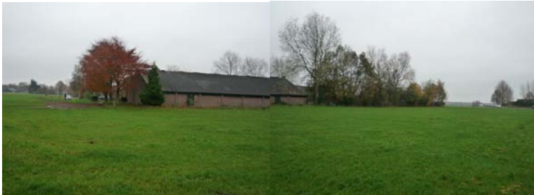
beeld vanaf de Veenschapsweg