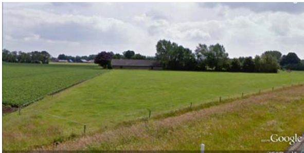
Beeld vanaf de N34

De nieuwe woning krijgt een eigen toegang op de openbare weg. ( voor de voorgevel van de bestaande woning.)