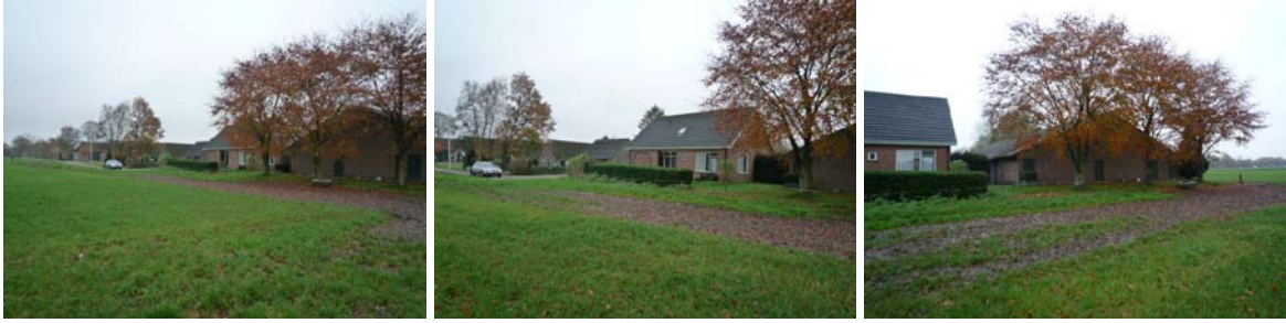
beeld vanaf de weg "Hooya's oord"