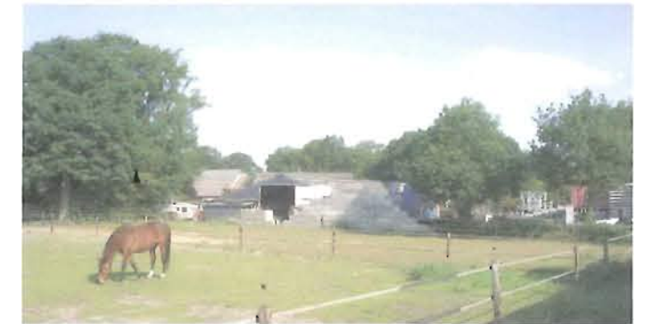
zicht vanaf zuidoost kant, bestaand eiken behouden aan bijplanten met 3 eiken daaronder streekeigen bosplantsoen .