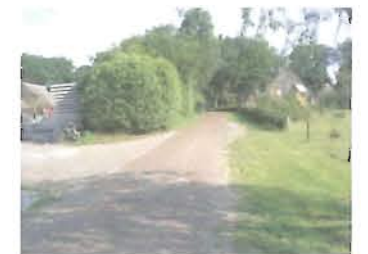
bestaand groen handhaven

3 st Quercus robur maat 12-14 definitieve plaats bepalen in het werk; - boom moet een goede toekomst tegemoet gaan - dus op voldoende afstand onderling en met aanwezige bomen - de bomen moeten zich kunnen ontwikkelen tot volwassen bomen.