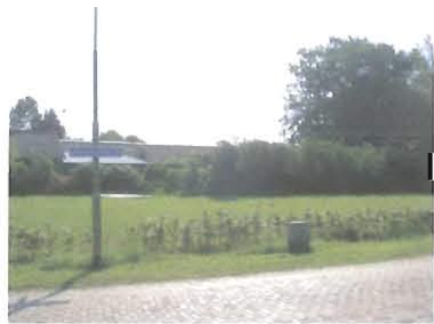
zicht vanaf Goornstraat

Om maximaal resultaat te krijgen Houtwal aanleggen mbv stapelmuur van 150x60x60 blokken 180 hoog - 3lagen Daarop hekwerk met klimop (zgn Greenwal achlig concept) Deze wal beplanten