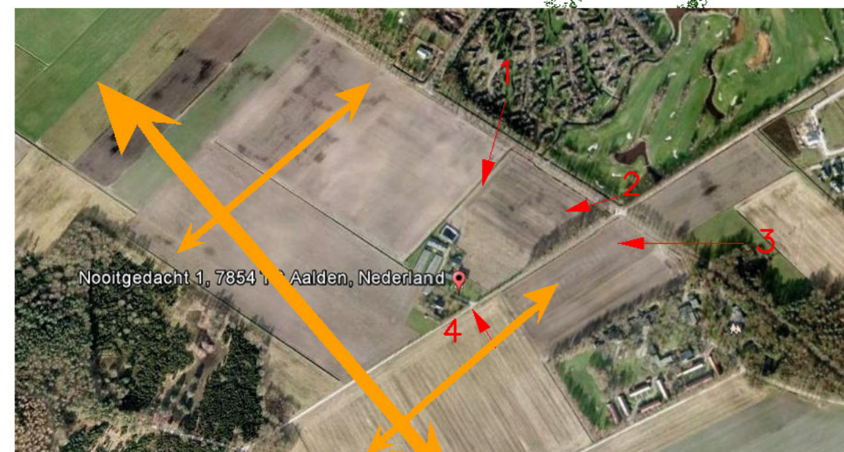
Openheid blijft intact (hoofdstructuur)

BOMEN 4st. te planten Lindes – Tilia x europea 14–16 15st te planten Eiken – Quercus robur 14–16 1st. te planten Walnoot – Juglans regia 14–16 4st. te planten Hoogstamfruitbomen