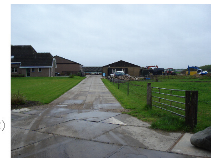
4 zicht vanaf Nooitgedacht