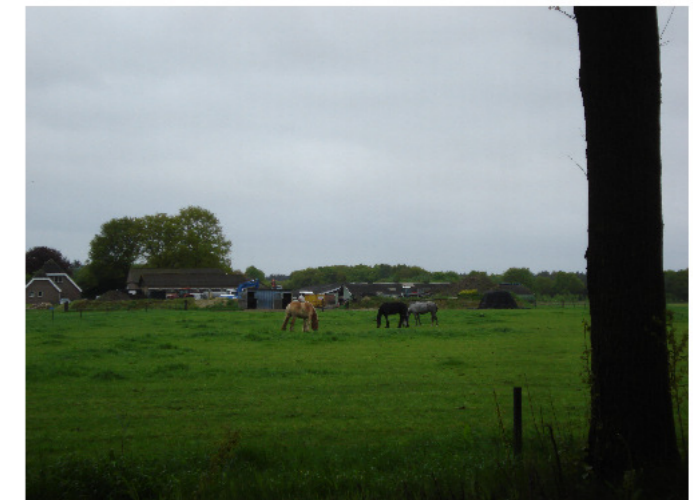
1 zicht vanaf gelpenberg

ONDERHOUD BOSPLANTSOEN 1e jaar onkruid bestrijding ,vrijhouden beplanting dmv maaien of schoffelen. Na 1 jaar inboeten in het 3e/4e jaar na aanplant 1e gefaseerde dunning , zgn wijkers en blijvers. Het eindresultaat is een singel met enkele uitgegroeide bomen met daaronder een gevarieerde onderbeplanting die gefaseerd wordt afgezet ( eens in de 6 jaar).