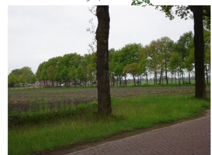
3 zicht vanaf gelpenberg