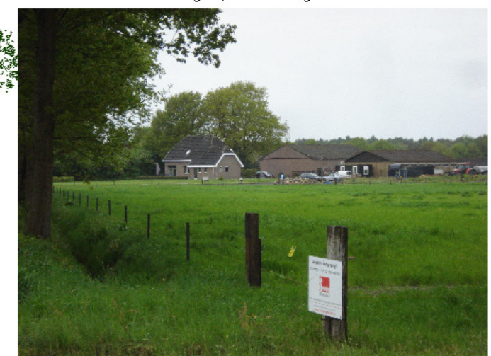
2 zicht vanaf gelpenberg