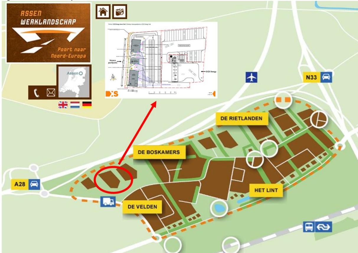
Figuur 3. Werklandschap Asen-Zuid5

In de gezamenlijke doelgroepen zit de duidelijke meerwaarde van de combinatie van de Energy Hub en het horecacluster. De beide voorzieningen kunnen tegelijkertijd gebruikt worden of op verschillende momenten. Het concept zet de locatie van het Werklandschap op de kaart. Een goede herkenbaarheid en zichtbaarheid van de locatie is een belangrijk aandachtspunt. Een reclamezuil of -mast en verwijzingsborden vanaf de snelweg zullen dit aandachtspunt verhelpen.