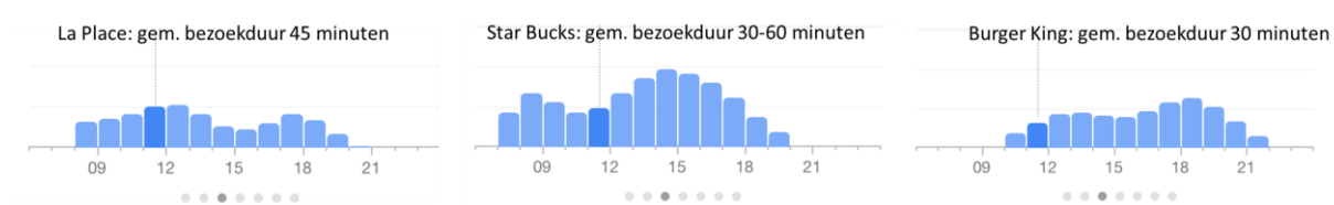
Figuur 5: Zoekresultaten van Google voor een voorbeeld-vestiging van La Place, Starbucks en Burger King

De verdeling over de dag is doorgerekend op basis van het bovenstaande aantal bezoekers per formule: gezamenlijk betekent dat in de ochtend 25%, in de middag 55% en in de avonden 20%. Deze formules sluiten doorgaans rond 21 tot 22 uur en gaan afhankelijk van het assortiment en de behoefte open op ontbijtmomenten.