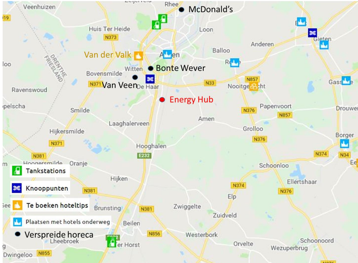
Figuur 4. Tank- en horecavoorzieningen langs snelweg en de belangrijkste horeca rondom Assen-Zuid 7

De meest nabije horecavoorzieningen langs deze snelwegen zijn: