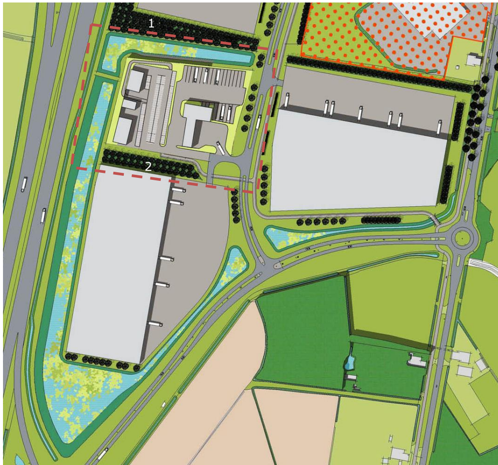
Stedenbouwkundig plan van fase 1

Ad b. In onderstaande figuur is het deel van het plan van de Energy Hub en het horecacluster rood omkaderd. Door het beoogde infrastructurele programma (parkeren en rijbanen) is weinig ruimte beschikbaar om op het terrein substantieel groen te realiseren. De groeninrichting is eenvoudig pragmatisch. De reden hiervoor is tweeledig. Het geheel is een publiekstrekker en papierafval in dergelijke openbare ruimte is een probleem. Het verwijderen van papierafval is arbeidsintensief en geeft snel een slordig beeld. Het toepassen van riet en rietvlonders op het terrein is beheerstechnisch niet uitvoerbaar. De bestaande houtwal (1) ligt buiten de plancontour van de 1 e fase en blijft in tact. De andere houtwal (2) betreft een nieuwe aanplanting en wordt op openbaar grondgebied gerealiseerd.