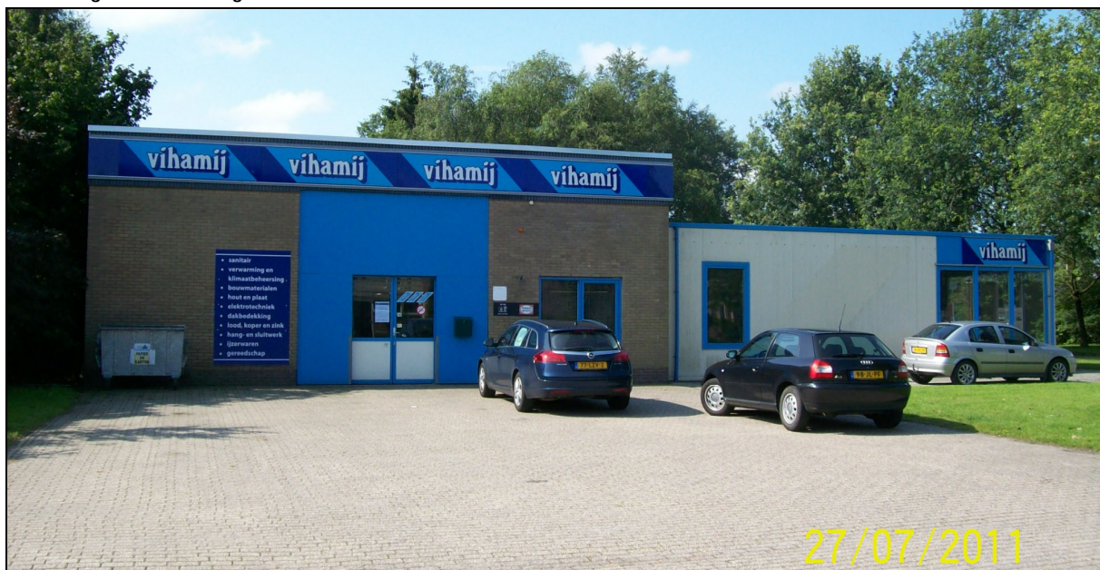
Afbeelding 1: de inrichting

In figuur 1 is de situering van de inrichting op het industrieterrein, in relatie tot de omgeving, weergegeven.