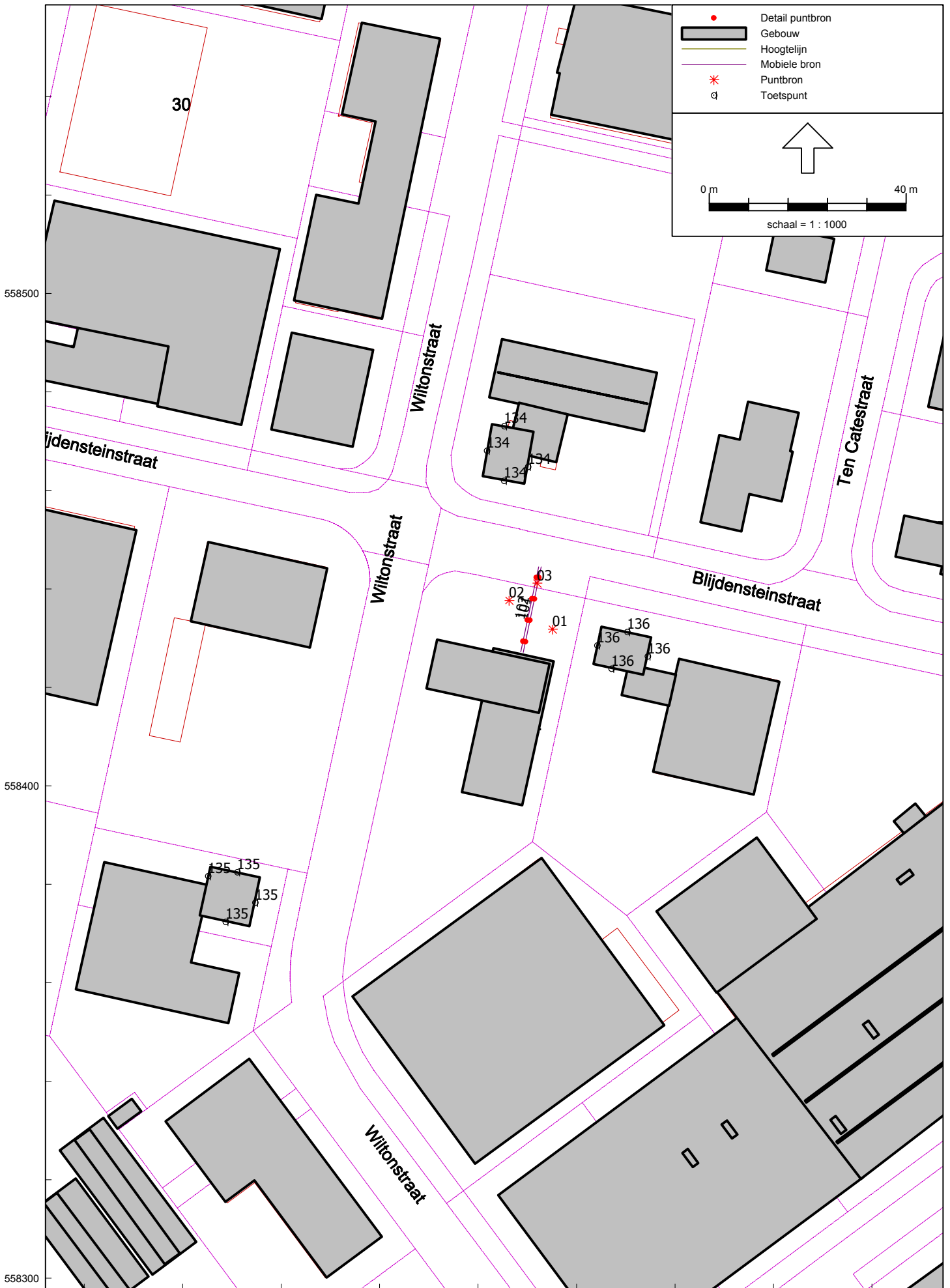
Computerplot met geluidbronnen en rekenpunten