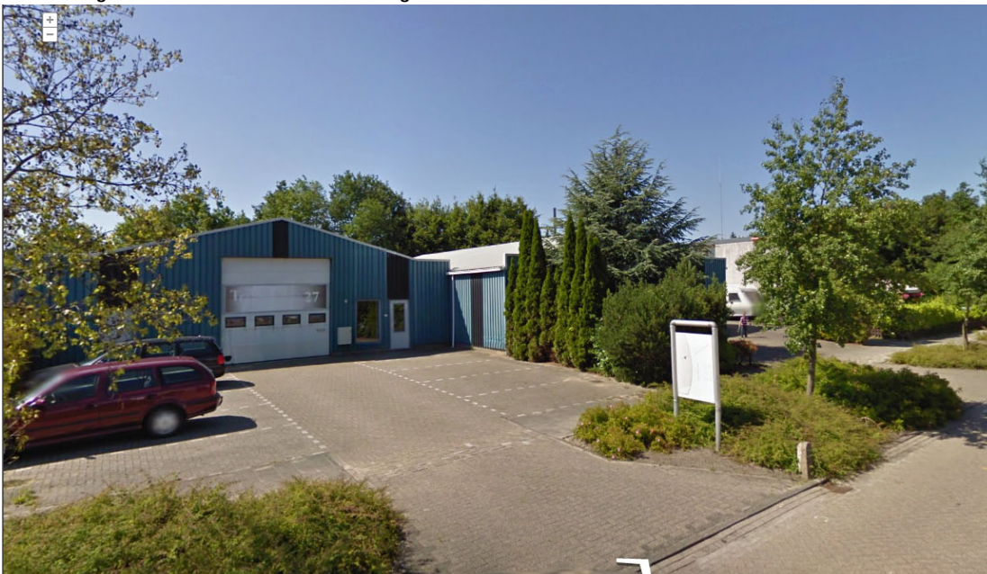
Afbeelding 1: situatie loods en rechtswoning derden

In figuur 1 is de situering van de inrichting op het industrieterrein weergegeven.