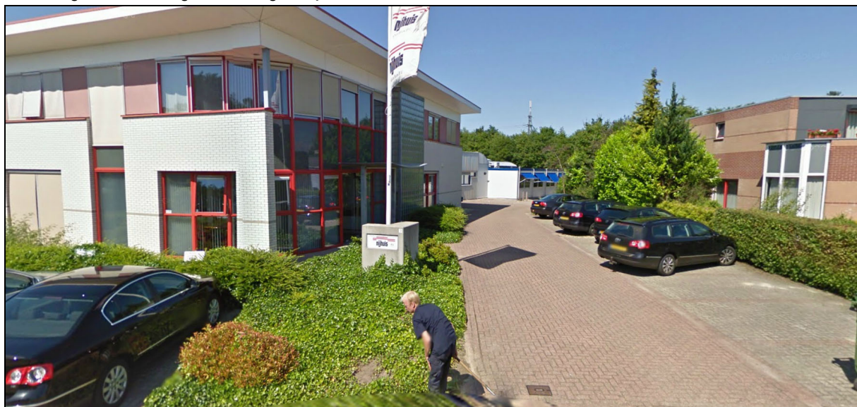
Afbeelding 1: de inrichting

In figuur 1 is de situering van de inrichting op het industrieterrein, in relatie tot de omgeving, weergegeven.