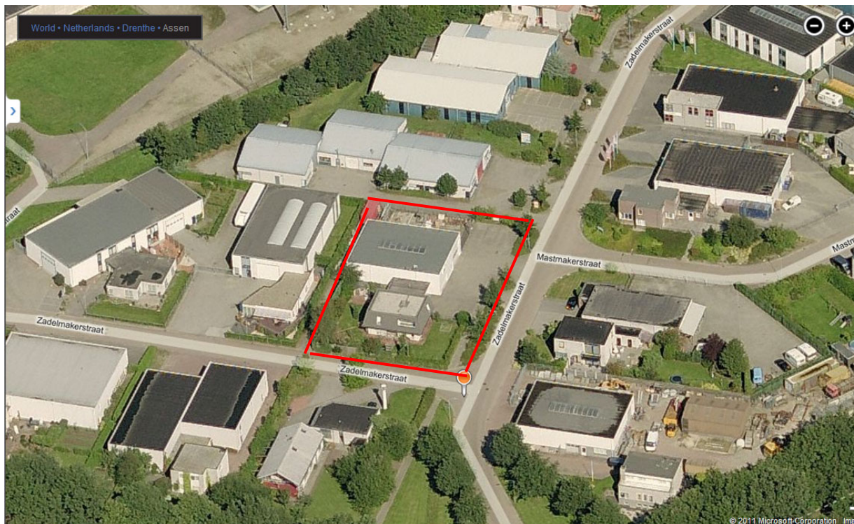
Afbeelding 1: situatie loods en bedrijfswoning

In figuur 1 is de situering van de inrichting op het industrieterrein in relatie tot de omgeving weergegeven.