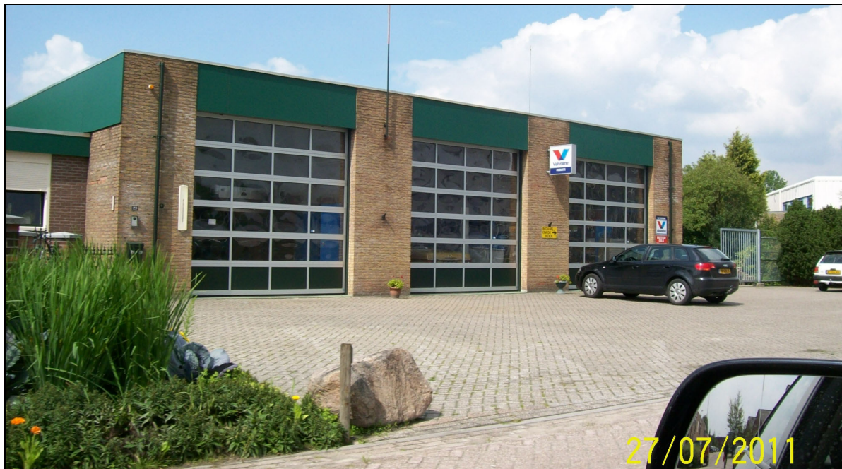
Afbeelding 1: de inrichting

In figuur 1 is de situering van de inrichting op het industrieterrein, in relatie tot de omgeving, weergegeven.