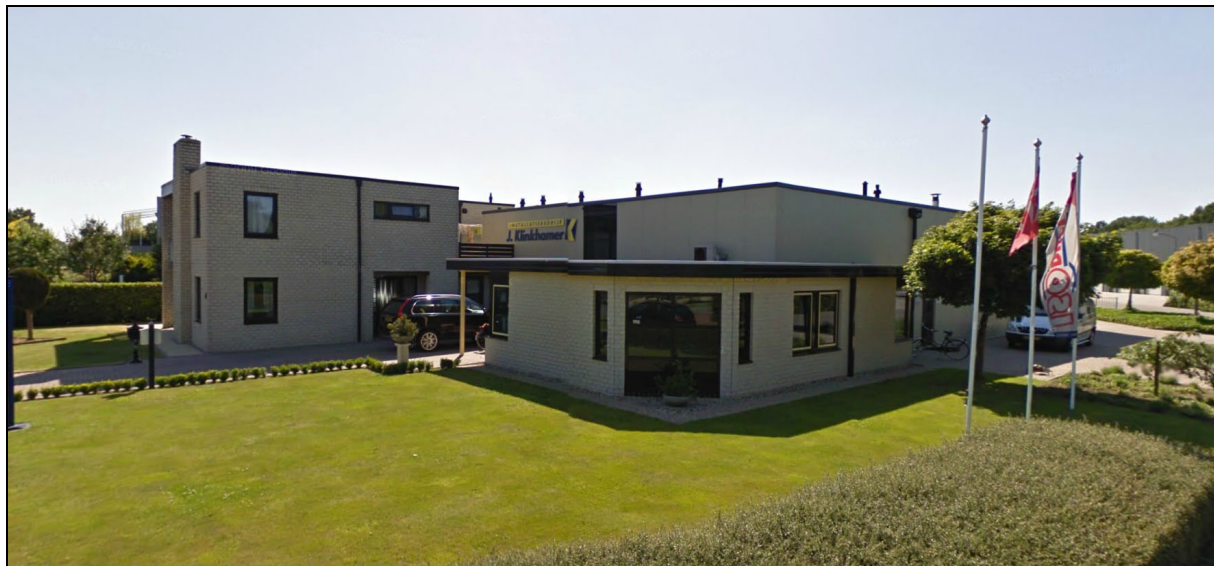
Afbeelding 1: de inrichting

In figuur 1 is de situering van de inrichting op het industrieterrein, in relatie tot de omgeving, weergegeven.