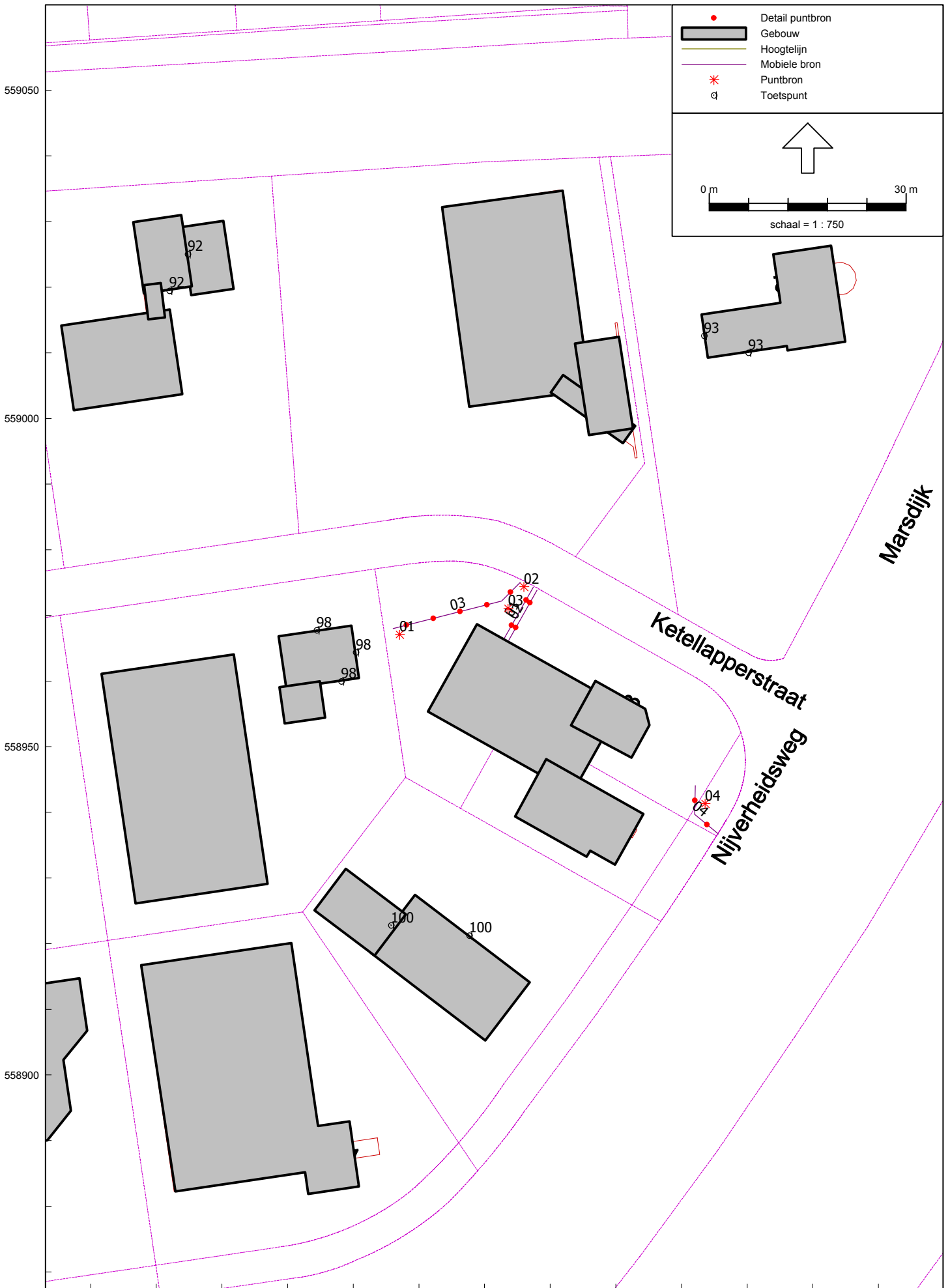
Computerplot met geluidbronnen en rekenpunten