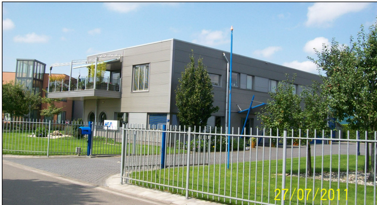
Afbeelding 1: de inrichting

In figuur 1 is de situering van de inrichting op het industrieterrein, in relatie tot de omgeving, weergegeven.