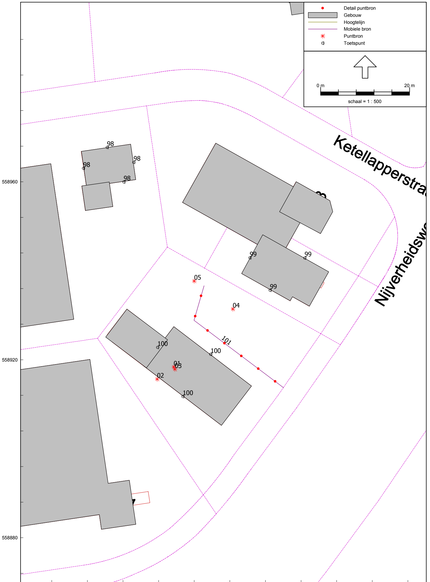
Computerplot met geluidbronnen en rekenpunten