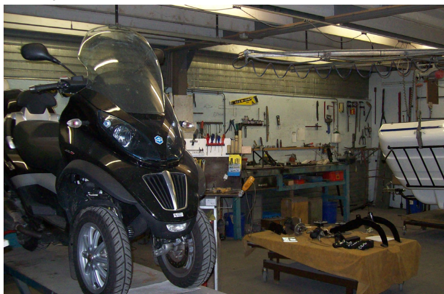
Afbeelding 2: situatie van de werkplaats

Bij het vaststellen van de geluidvermogeniveaus van de geluidafstraling van de overheadeur is gebruik gemaakt van de verrichte metingen. Voor het binnenniveau is een geluidniveau van 85 dB(A) vastgesteld. Voor de overige bronnen, zoals vrachtverkeer, is gebruik gemaakt van het meetarchief van ons bureau. Deze geluidvermogens zijn vastgesteld op basis van een groot aantal geluidmetingen bij vergelijkbare inrichtingen.