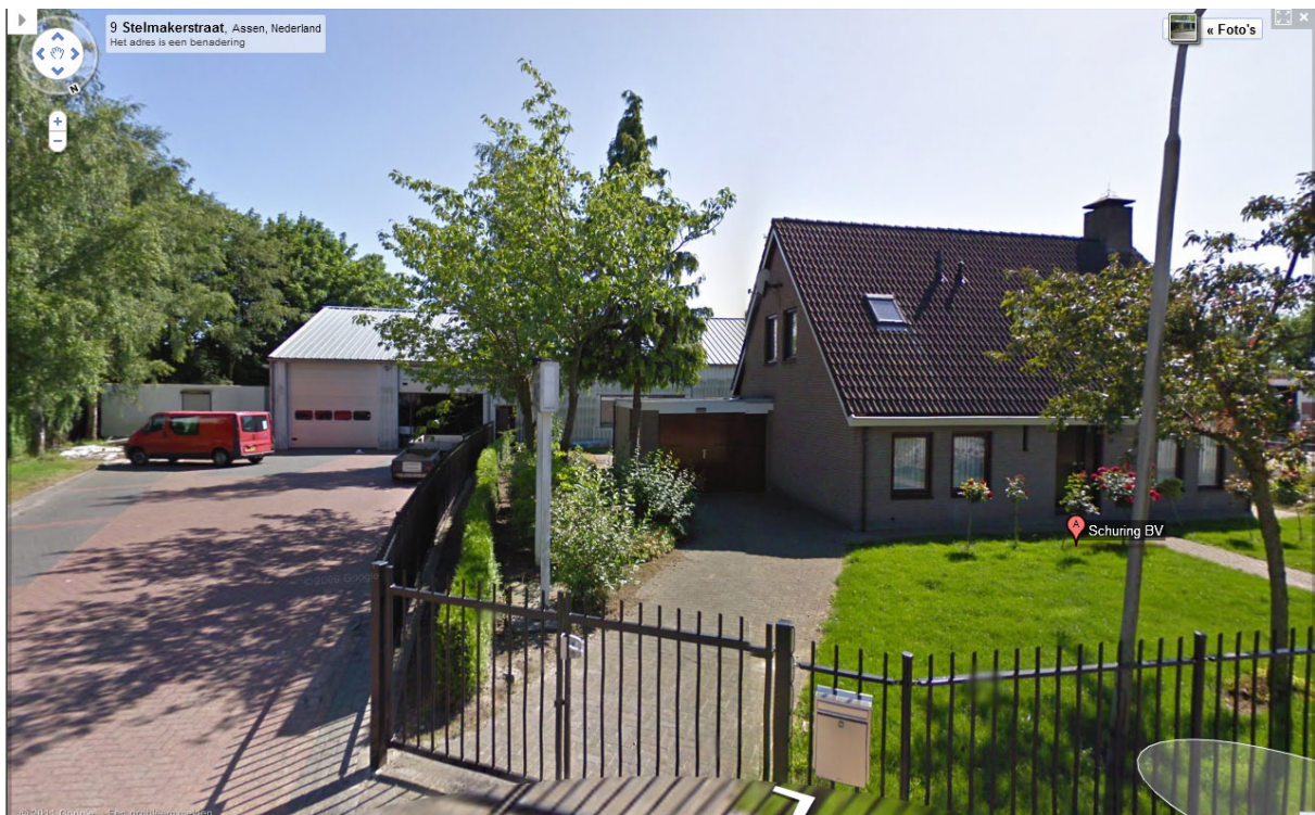
Afbeelding 1: situatie loods en eigen bedrijfswoning.

In figuur 1 is de situering van de inrichting op het industrieterrein in relatie tot de omgeving weergegeven.