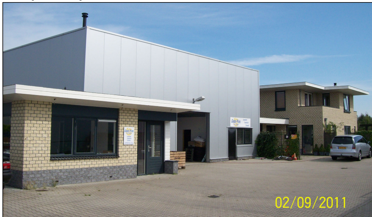
Afbeelding 1: de inrichting

In figuur 1 is de situering van de inrichting op het industrieterrein, in relatie tot de omgeving, weergegeven.