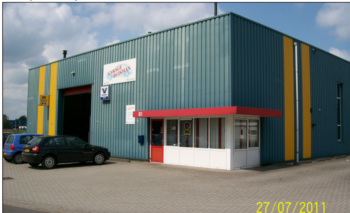
Afbeelding 1: de inrichting

In figuur 1 is de situering van de inrichting op het industrieterrein, in relatie tot de omgeving, weergegeven.