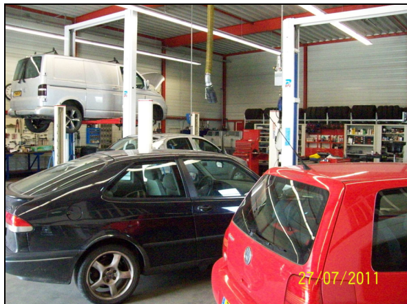
Afbeelding 4.1: werkplaats