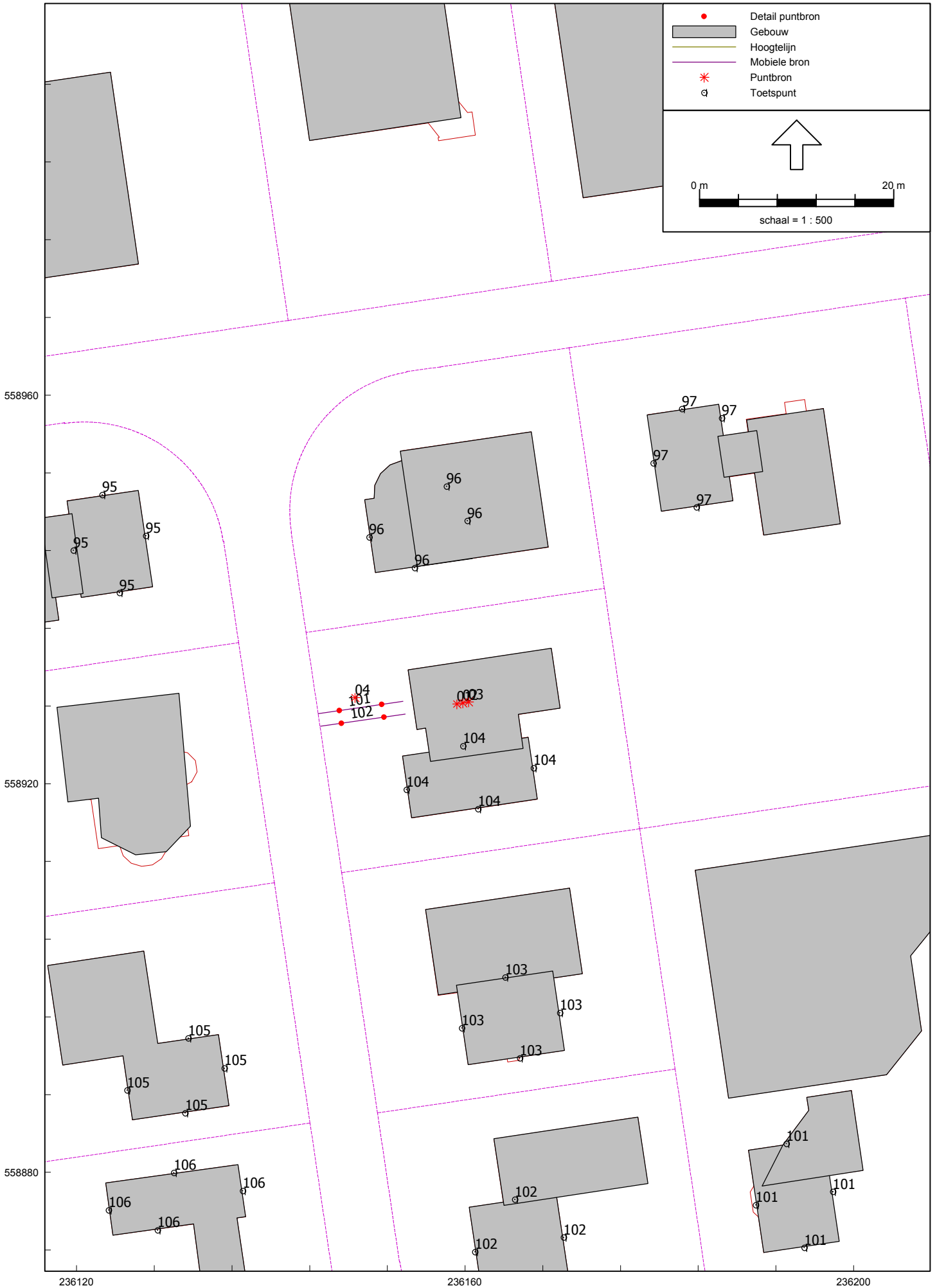
Computerplot met geluidbronnen en rekenpunten