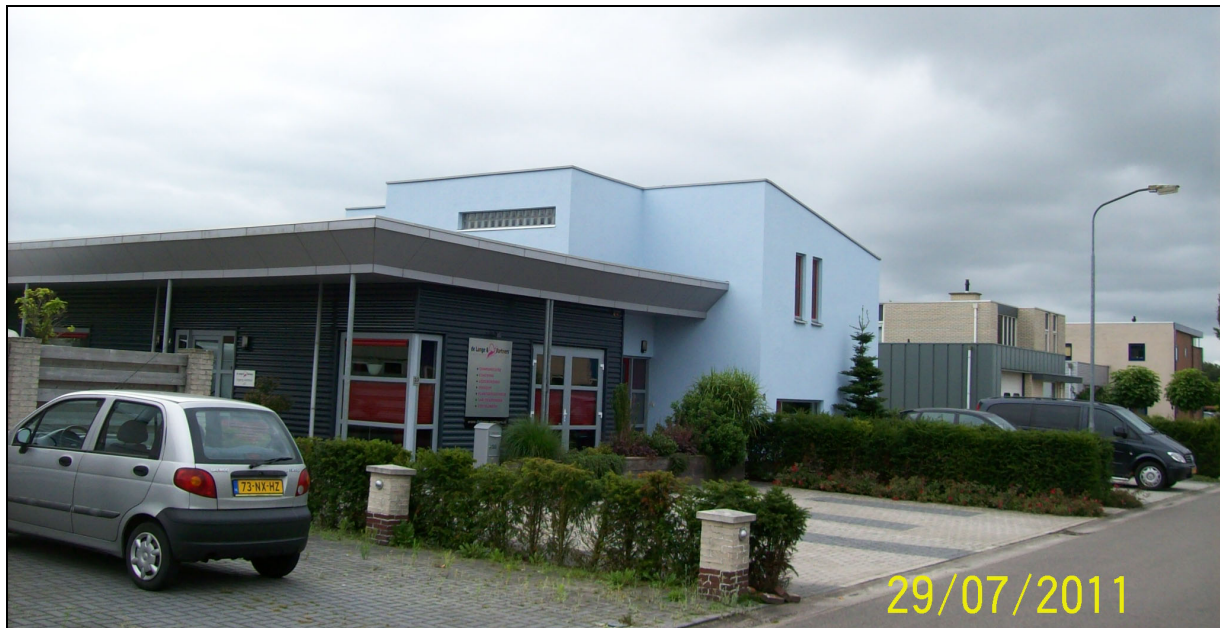
Afbeelding 1: de inrichting

In figuur 1 is de situering van de inrichting op het industrieterrein, in relatie tot de omgeving, weergegeven.