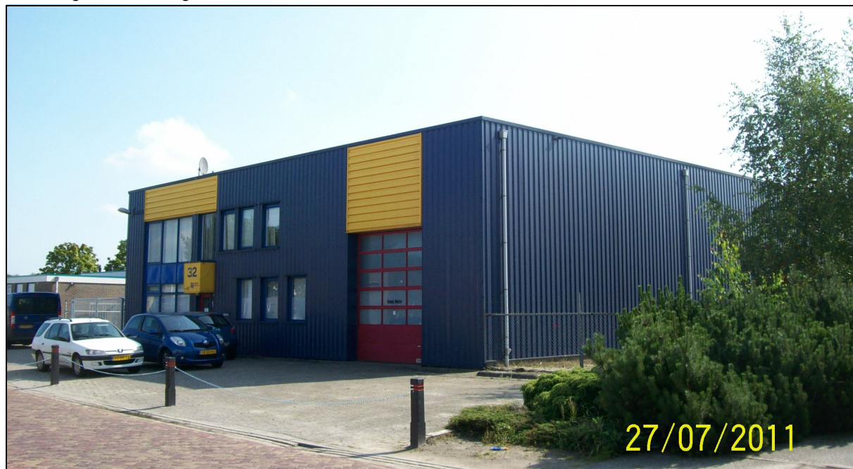
Afbeelding 1: de inrichting

In figuur 1 is de situering van de inrichting op het industrieterrein, in relatie tot de omgeving, weergegeven.