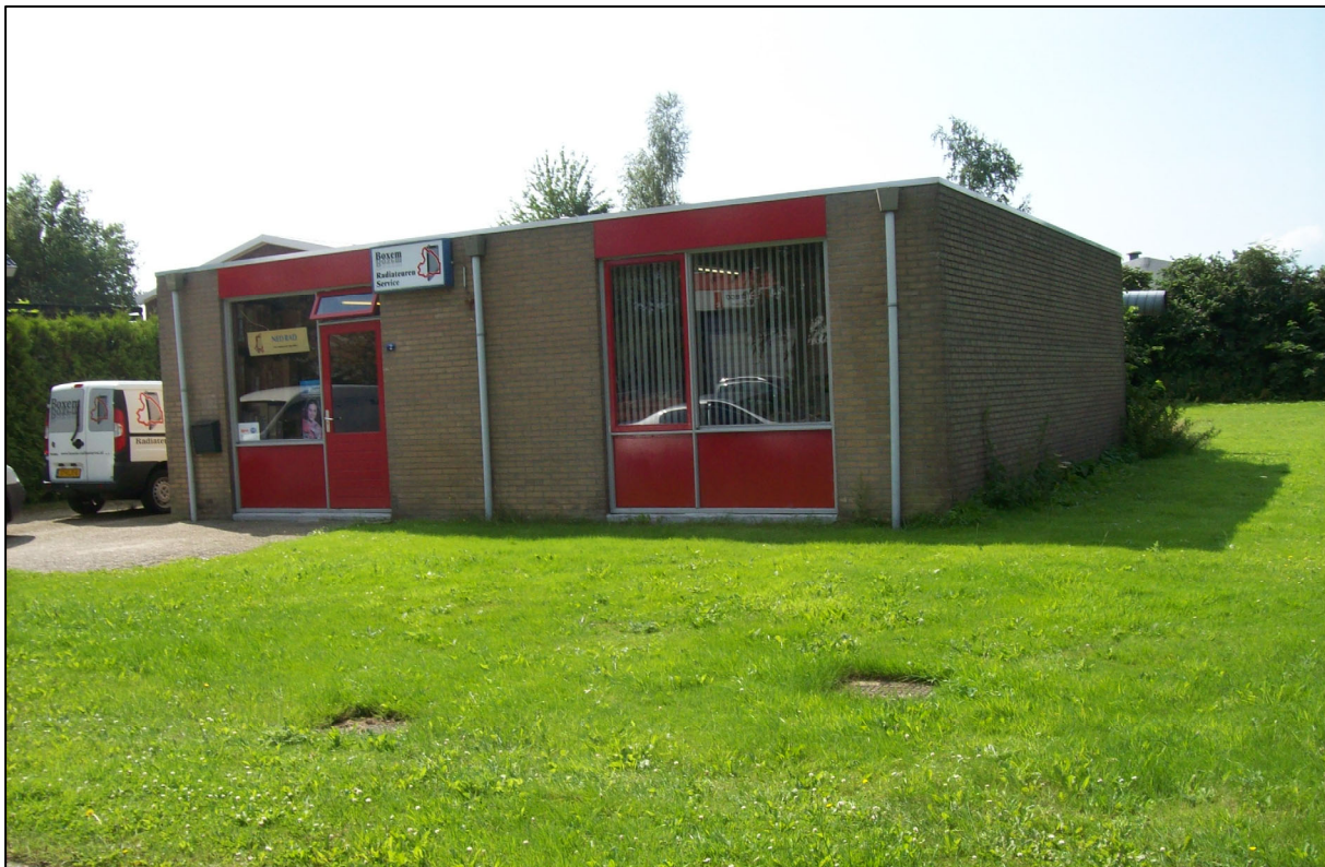
Afbeelding 1: de inrichting

De inrichting is gelegen aan de Wagenmakerstraat 2 in Assen. Het bedrijf verricht onderhoud en reparatie aan autoradiateurs en beschikt hiertoe over een kantoor, magazijn en werkplaats.