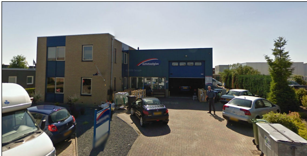
Afbeelding 1: de inrichting

In figuur 1 is de situering van de inrichting op het industrieterrein, in relatie tot de omgeving, weergegeven.