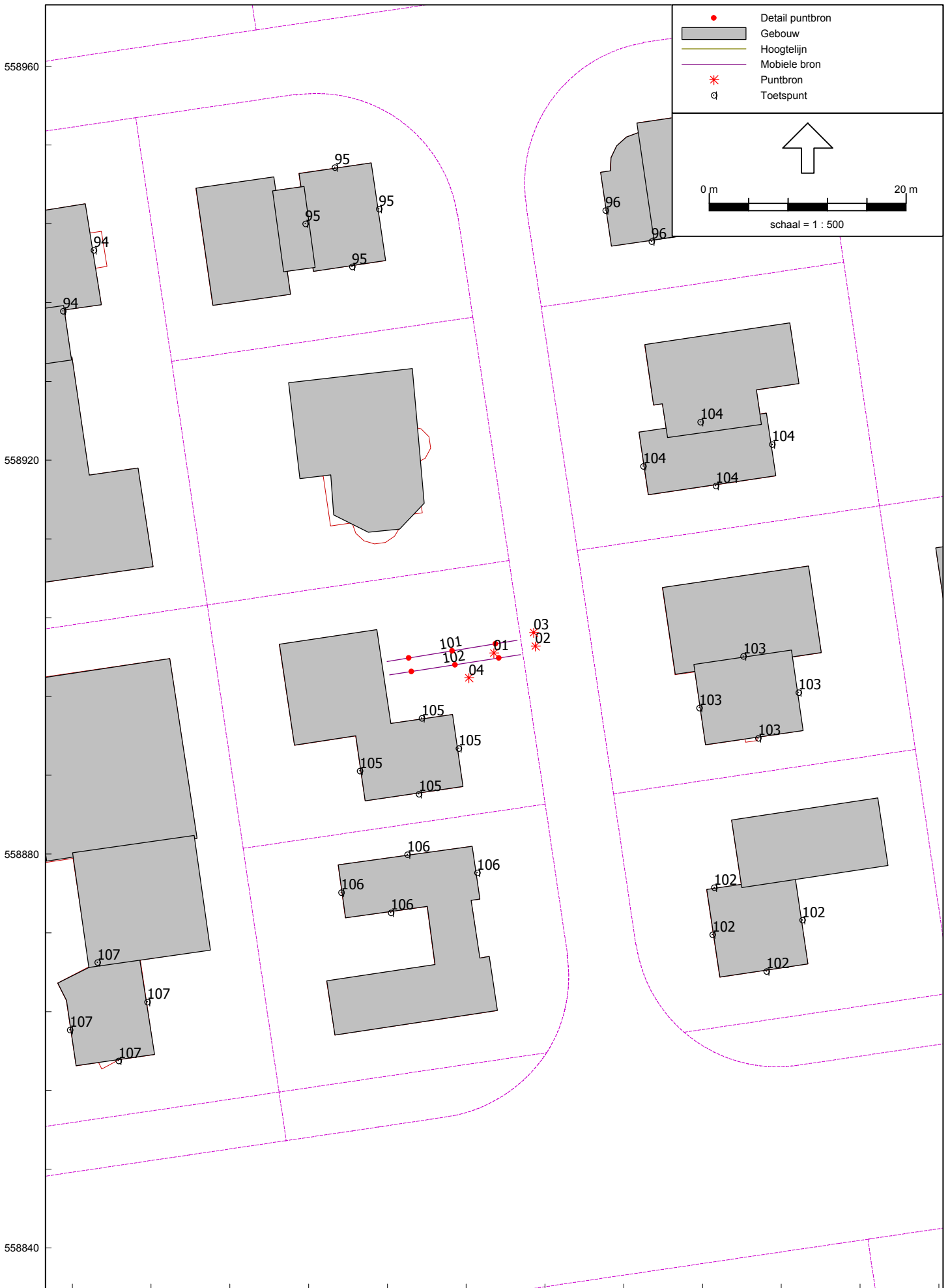
Computerplot met geluidbronnen en rekenpunten