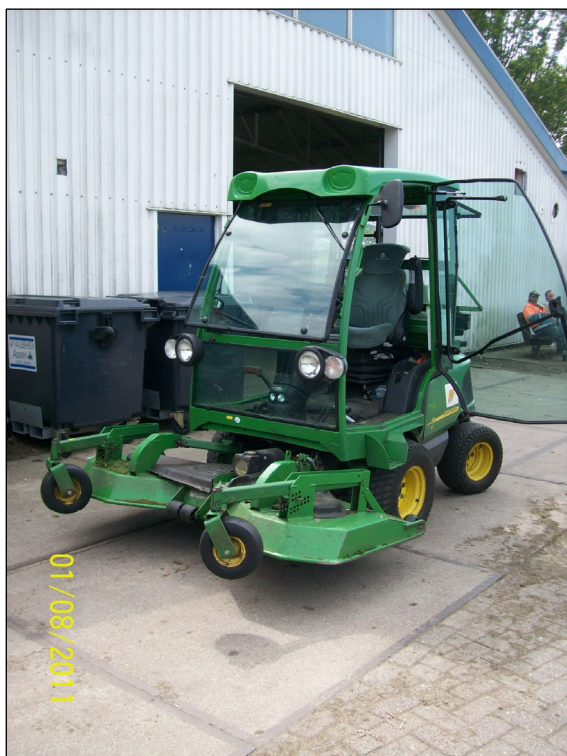
Afbeelding 4.1: grasmachine