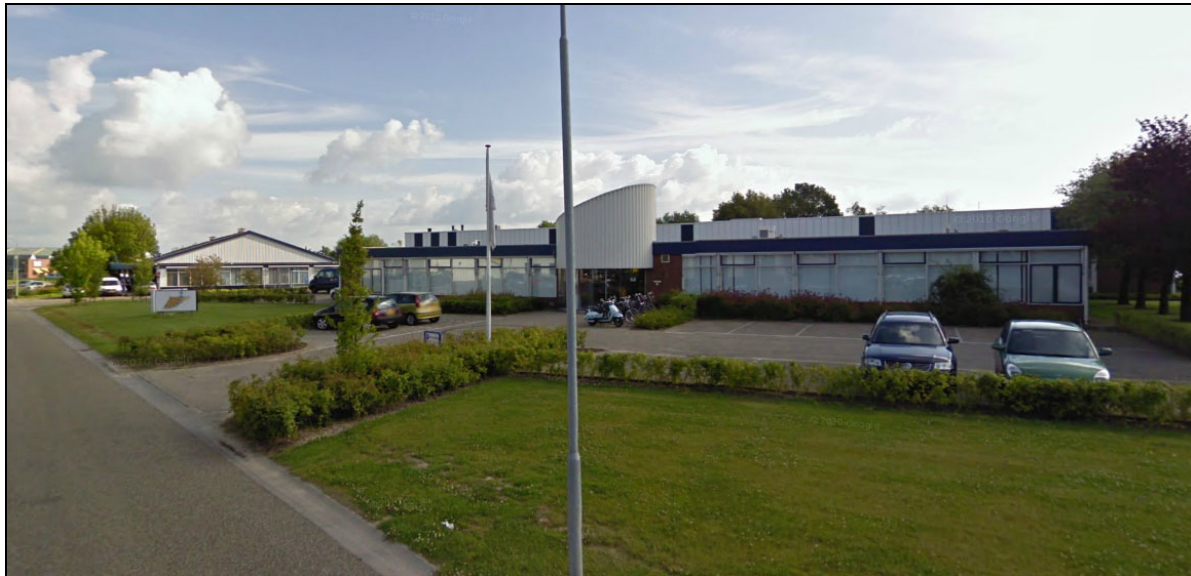
Afbeelding 1: de inrichting (bron: Google maps)

In figuur 1 is de situering van de inrichting op het industrieterrein, in relatie tot de omgeving, weergegeven.