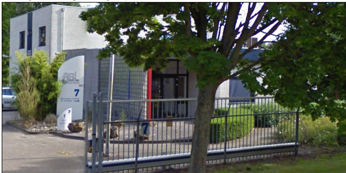
Afbeelding 1: de inrichting

In figuur 1 is de situering van de inrichting op het industrieterrein, in relatie tot de omgeving, weergegeven.