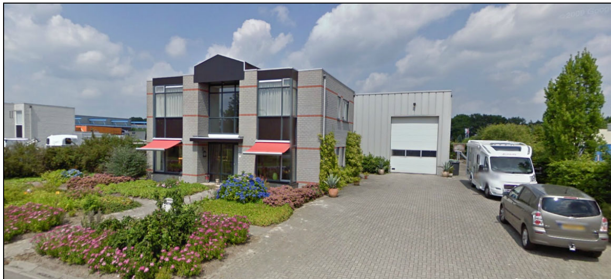
Afbeelding 1: de inrichting

In figuur 1 is de situering van de inrichting op het industrieterrein, in relatie tot de omgeving, weergegeven.