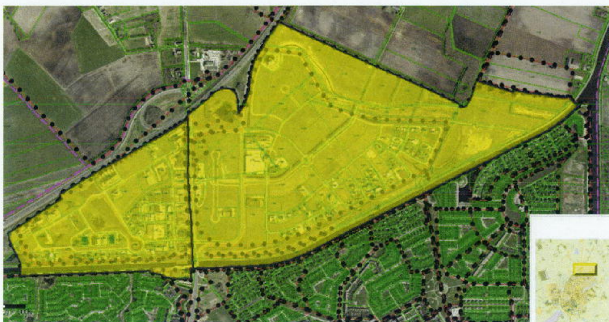
Figuur 1. Globale begrenzing van het plangebied (gele kleur)

Auteur: D.H. van Dijken Datum: 20 februari 2012