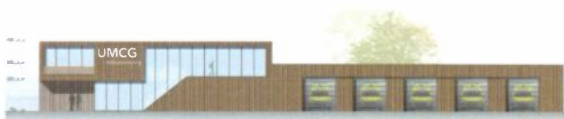
Figuur 1 Ligging plangebied (geel omrand gebied) en ontwerp voorgevel ambulancepost