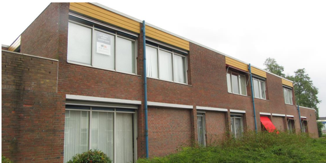
Figuur 2.8. Oostzijde kantoorpand.