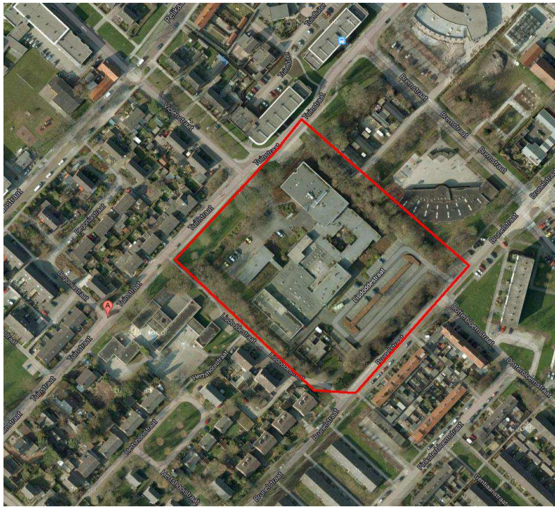
Figuur 1: De ligging van het plangebied bij benadering, rood omlijnd.

In het plangebied is tussen en rond de houtsingel bestrating aanwezig, vaak overwoekerd met diverse kruiden.