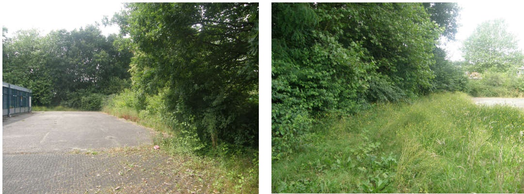
Figuur 2: Impressie van het plangebied.

In het plangebied is tussen en rond de houtsingel bestrating aanwezig, vaak overwoekerd met diverse kruiden.