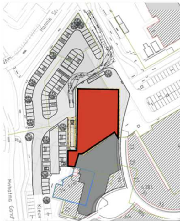
Wenselijk eindbeeld van het plangebied.

Op onderstaande afbeelding wordt het wenselijke eindbeeld weergegeven.