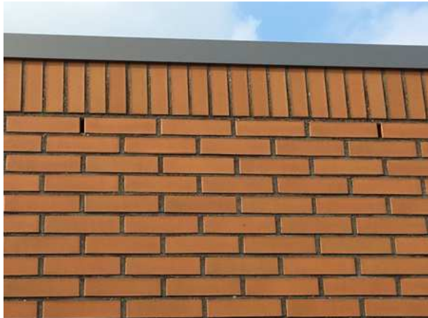
Open stootvoegen in de buitengevel. Er zijn geen aanwijzingen gevonden dat vleermuizen deze open stootvoegen benutten om de spouw te betreden.

Op basis van een visuele inspectie wordt geconcludeerd dat vleermuizen de spouw niet betreden via open stootvoegen en dat andere potentiële verblijfplaatsen, zoals windveren, dakpannen, geïsoleerde zolders en vensterluiken ontbreken. Daar komt bij dat vleermuizen zeer honkvast zijn en niet snel nieuwe verblijfplaatsen betrekken. De bebouwing in het plangebied is vrij 'jong' en daarom mogelijk nog niet in gebruik genomen als verblijfplaats.