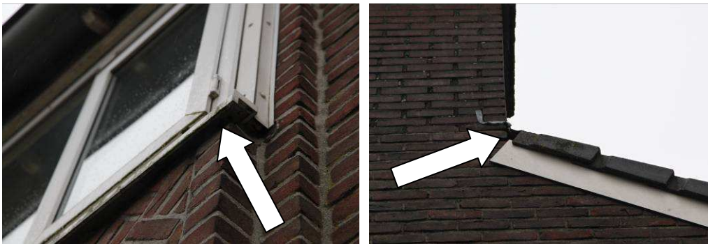
Figuur 3: Potentiële in- en uitvliegopeningen onder vensterbanken en op de zijgevels.

Er werden op verschillende locaties potentiële verblijfplaatsen van vleermuizen waargenomen. Onder de nokpannen, gevelpannen, onder vensterbanken en langs kozijnen bevinden zich kieren en spleten waarlangs vleermuizen in de spouwmuren en onder dakpannen kunnen komen (zie figuur 3). De te slopen gebouwen zijn van een type waarin vaak verblijfplaatsen van vleermuizen worden aangetroffen.