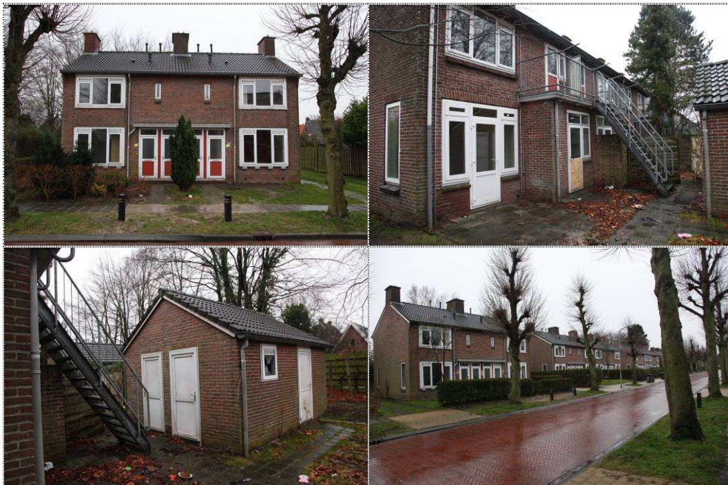
Figuur 2: Impressie van het plangebied aan de Pelikaanstraat.

Het plangebied bestaat uit voormalige huurwoningen met tuinen. Er zijn zowel duplexwoningen als rijtjeswoningen aanwezig. De tuinen zijn over het algemeen spaarzaam begroeid. Er zijn relatief weinig bomen en struweel aanwezig. Langs de weg is laanbeplanting aanwezig die behouden zal blijven.