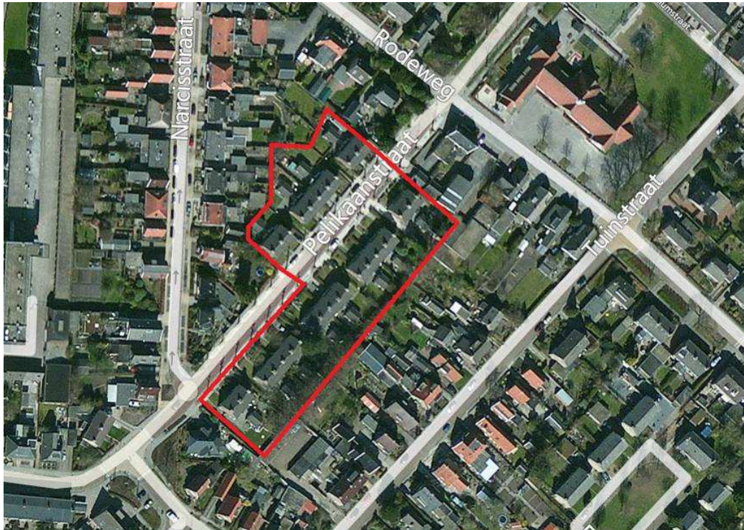
Figuur 1: De ligging van het plangebied in de bebouwde kom van Assen..

Het plangebied bestaat uit voormalige huurwoningen met tuinen. Er zijn zowel duplexwoningen als rijtjeswoningen aanwezig. De tuinen zijn over het algemeen spaarzaam begroeid. Er zijn relatief weinig bomen en struweel aanwezig. Langs de weg is laanbeplanting aanwezig die behouden zal blijven.