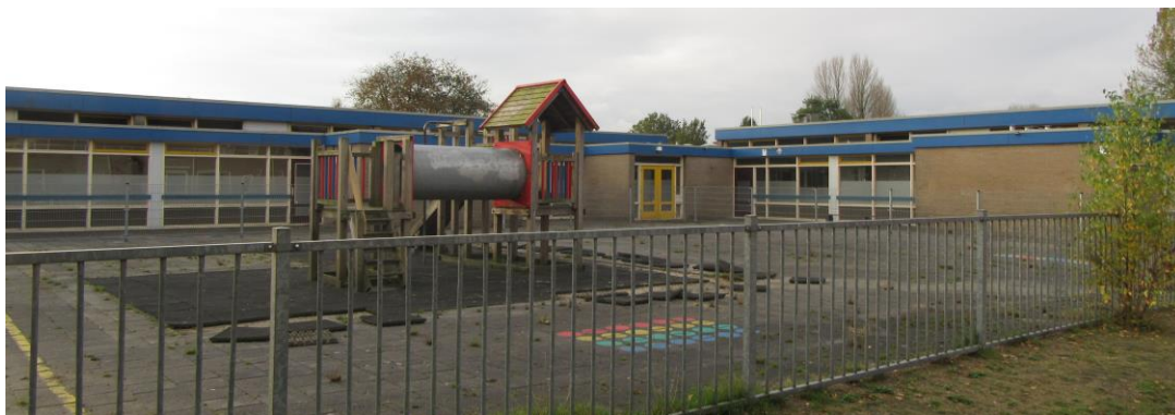
Figuur 2.4. Speelplein met westzijde jongerenopvang.