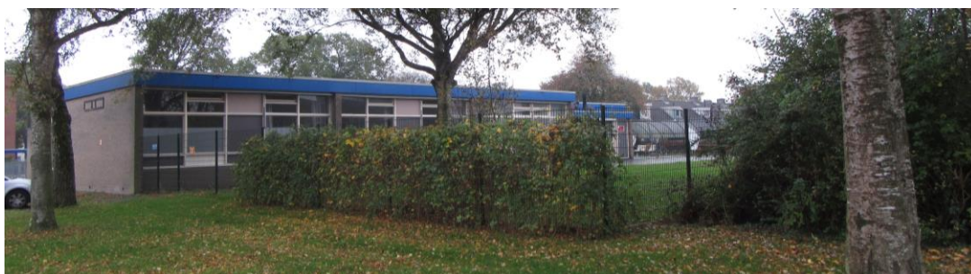
Figuur 2.5. Zuidoostzijde jongerenopvang.