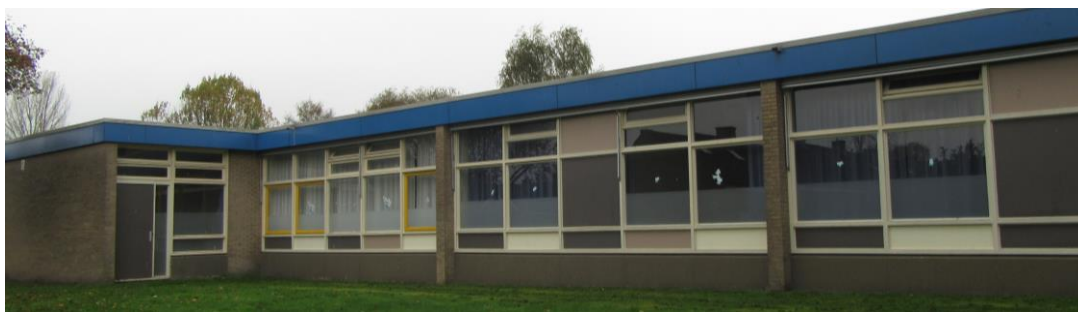
Figuur 2.3. Oostzijde jongerenopvang.