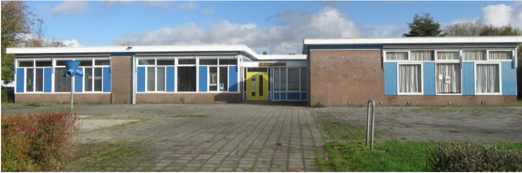
Figuur 2.18. Zuidwestzijde Vredevelschool.