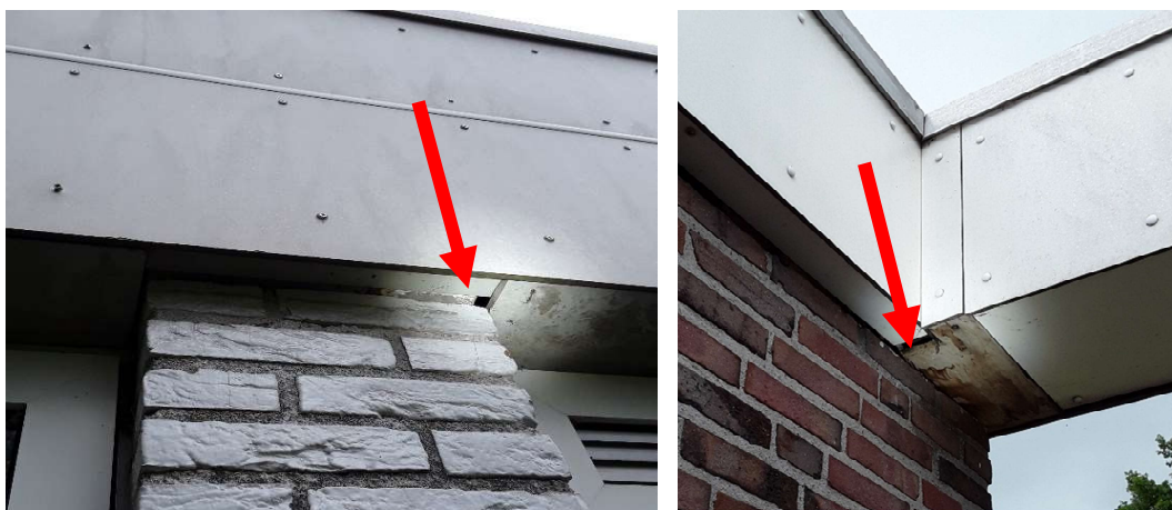
Foto 13 Voorbeelden van kieren in betimmering