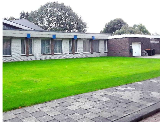
Foto 2 Vooraanzicht met aangrenzende woning