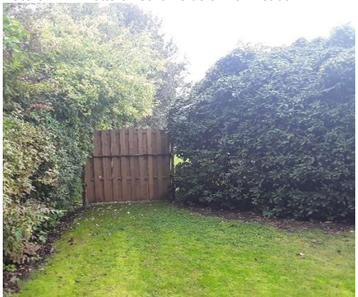
Foto 5 Achtertuin met o.a. kamperfoelie en rhododendron