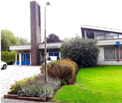
Foto 1 Vooraanzicht met klokkentoren