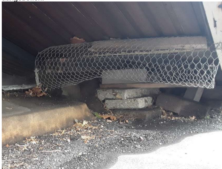
Foto 15 Voorbeeld van met gaas dichtgemaakte openingen op het dak tegen steenmarters

De huidige kostenverteerder vertelde, dat enkele jaren geleden verschillende openingen in het dak met gaas zijn afgedekt om een aanwezige steenmarter buiten te sluiten (Foto 15). De huidige bewoner van nummer 138 meent nu en dan een steenmarter in het plafond te horen lopen. Het plafond is hol, voor steenmarter geschikte openingen aan de buitenzijde van het gebouw zijn tijdens het veldbezoek echter niet waargenomen. Veeg- of krassporen of uitwerpselen van steenmarter zijn tijdens het veldbezoek niet aangetroffen.