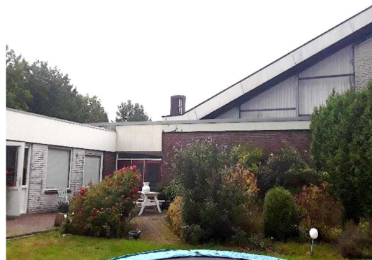
Foto 6 Achteraanzicht