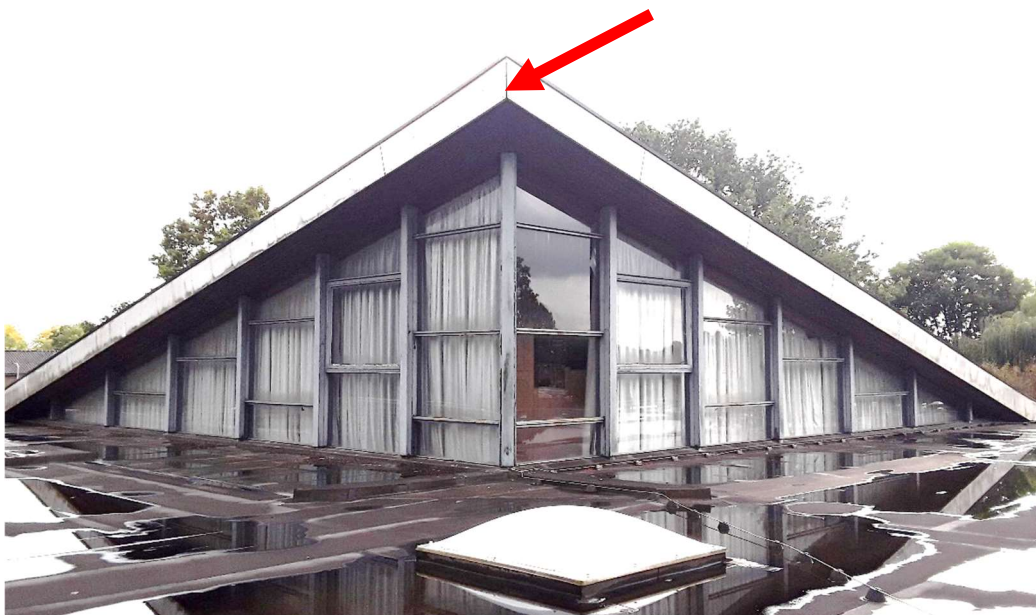
Foto 10 Kier in betimmering in de punt van het dak