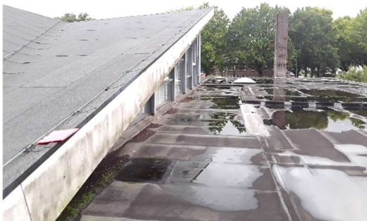
Foto 3 Platte en schuine delen van het dak