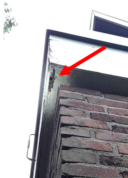
Foto 9 Kier achter het hek nabij Mr. Groen Van Prinstererlaan