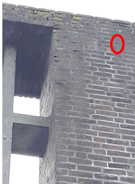
Foto 12 Mogelijk open stootvoeg in de klokkentoren