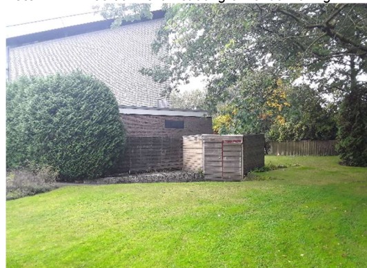
Foto 4 Tuin achter de kerk, met houten hokje