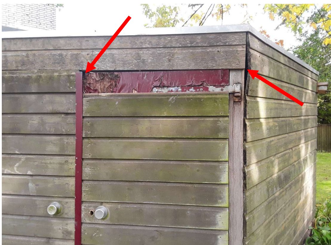
Foto 14 Hokje in de tuin, met kieren waardoor vleermuizen mogelijk naar binnen kunnen