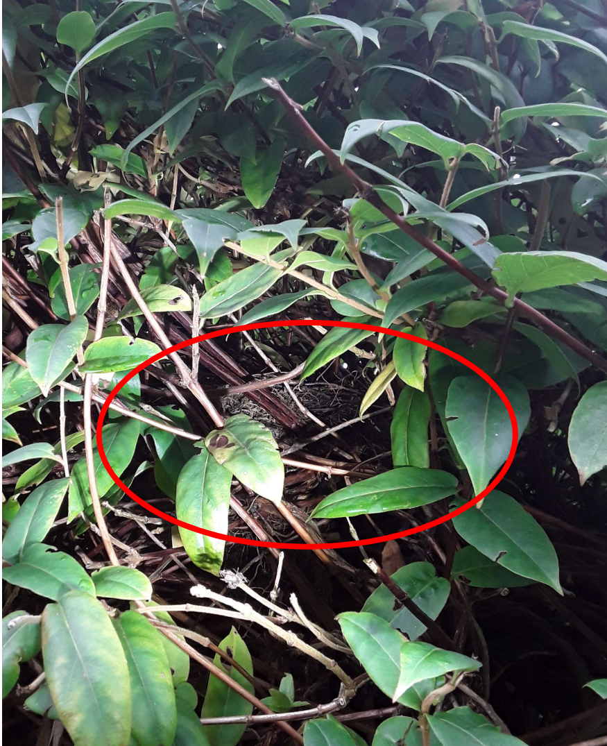
Foto 7 Lijsternest in de achtertuin van de woning, Nobellaan 138