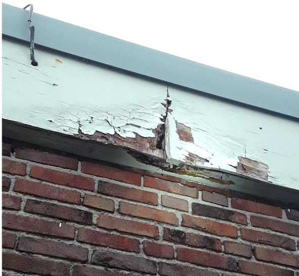
Foto 8 Opening in betimmering, tuinzijde

Vleermuizen verblijven in bomen en/of gebouwen. In het plangebied zijn bomen met geschikte holtes afwezig. Daardoor ontbreken verblijfplaatsen voor boombewonende vleermuissoorten. Het te slopen gebouw binnen het plangebied vertoont wel diverse openingen, waardoor vleermuizen ruimtes achter betimmering en in het dak kunnen bereiken. Dit zijn met name kieren in de betimmering op verschillende plekken rondom het gebouw, en bij de deur van het houten hokje in de tuin (Foto's 8 t/m 14 tonen voorbeelden). Het houten hok is daarmee mogelijk geschikt als verblijfplaats van grootoorvleermuizen. In de klokkentoren is mogelijk een open stootvoeg aanwezig (Foto 12), verder zijn open stootvoegen afwezig.