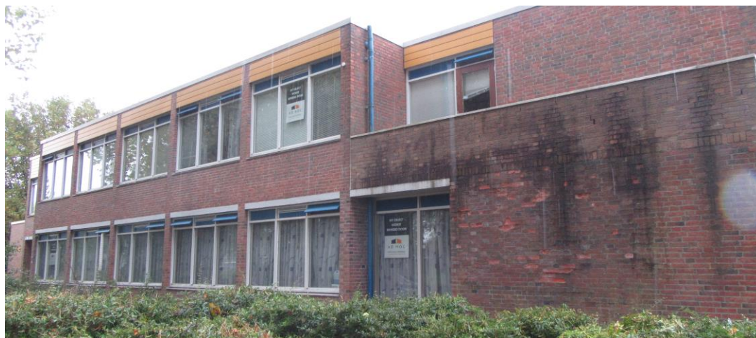
Figuur 2.7. Voorzijde kantoorpand (zuidzijde).