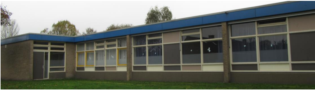
Figuur 2.3. Oostzijde jongerenopvang.