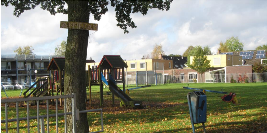
Figuur 2.16. Speelweide ten zuidwesten van het pand.