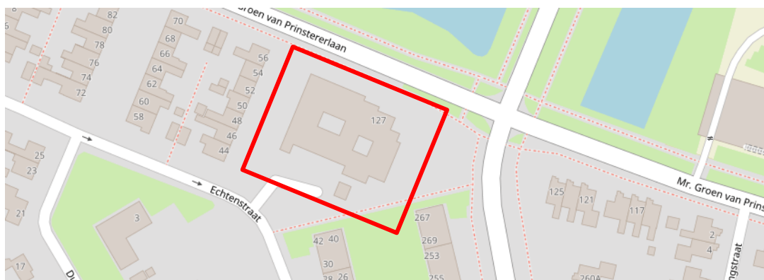
Figuur 2.6. Locatie kantoorpand aan de Mr. Groen van Prinstererlaan 127 te Assen.

In figuur 2.6 is de locatie op kaart weergegeven. Figuur 2.7 tot en met 2.9 geven de huidige situatie weer.