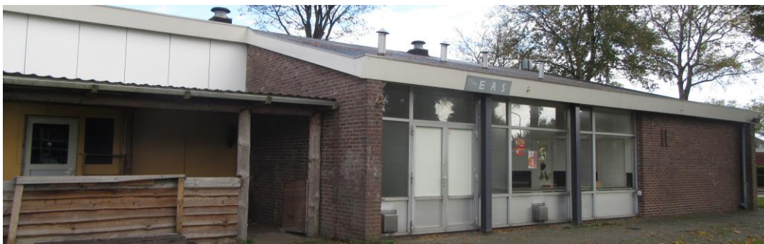
Figuur 2.15. Zuidwestzijde pand.