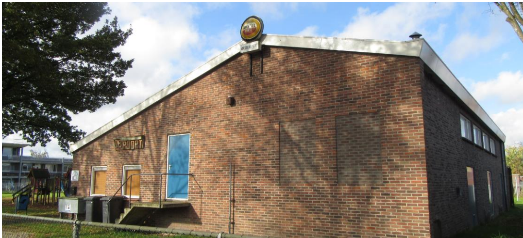
Figuur 2.14. Zuidoostzijde pand.