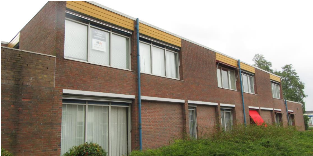
Figuur 2.8. Oostzijde kantoorpand.