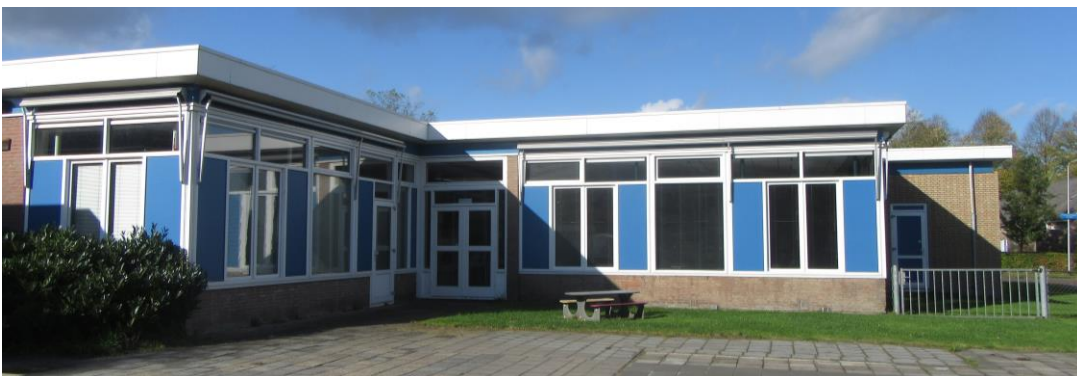
Figuur 2.20. Noordoostzijde Vredevelschool.