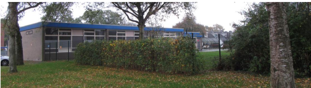
Figuur 2.5. Zuidoostzijde jongerenopvang.