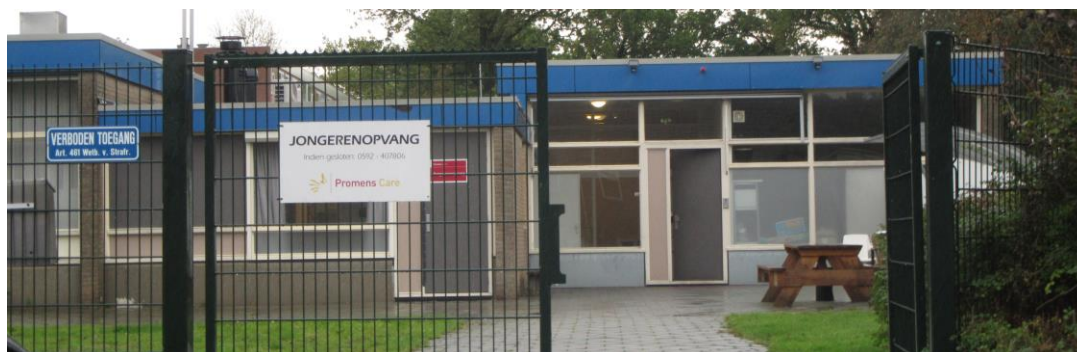
Figuur 2.2. Entree jongerenopvang (zuidzijde pand) met gedeelte van het entreeplein.