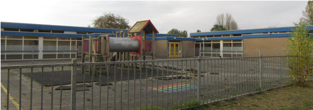
Figuur 2.4. Speelplein met westzijde jongerenopvang.