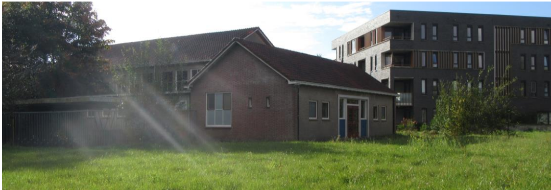
Figuur 2.11. Noord- en westzijde sporthal, ingang bevindt zich aan de rechterkant.