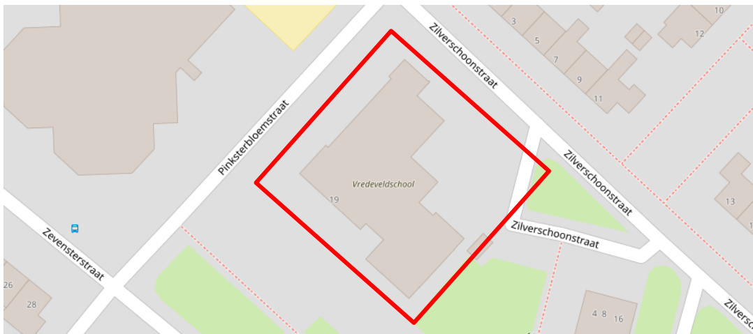
Figuur 2.17. Locatie Vredeveldschool, gelegen aan de Zevensterstraat 19 te Assen.

In figuur 2.17 is de locatie op kaart weergegeven. Figuur 2.18 tot en met 2.20 geven de huidige situatie weer.