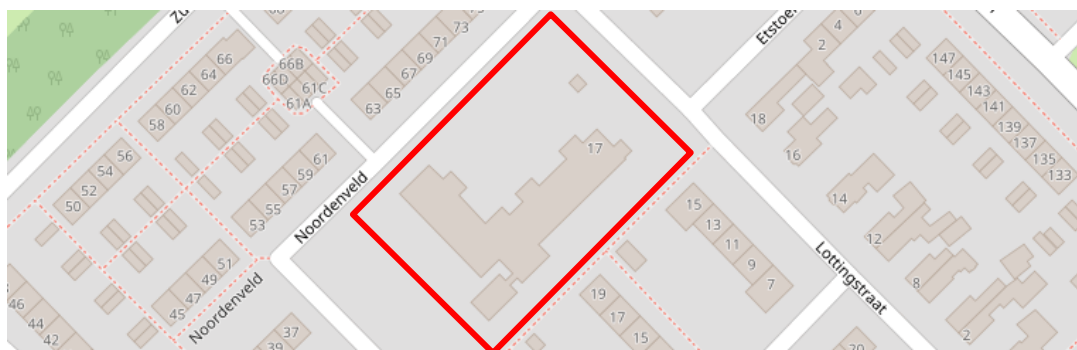
Figuur 2.1. Ligging jongerenopvang (rood omlijnd) aan de Lottingstraat 17 te Assen.

In figuur 2.1 is de locatie op kaart weergegeven. Figuur 2.2 tot en met 2.5 geven de huidige situatie weer.