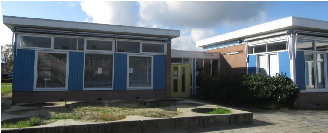
Figuur 2.19. Zuidoostzijde Vredevelschool.