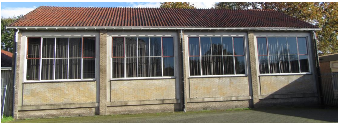
Figuur 2.12. Zuidzijde sporthal.