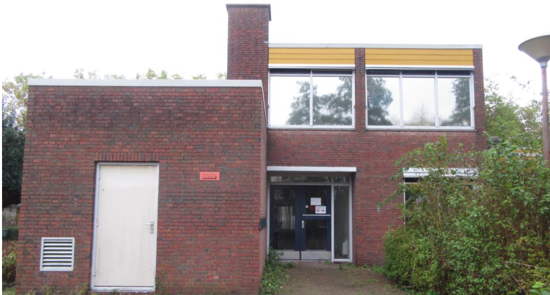
Figuur 2.9. Noorzijde kantoorpand (linker gedeelte).