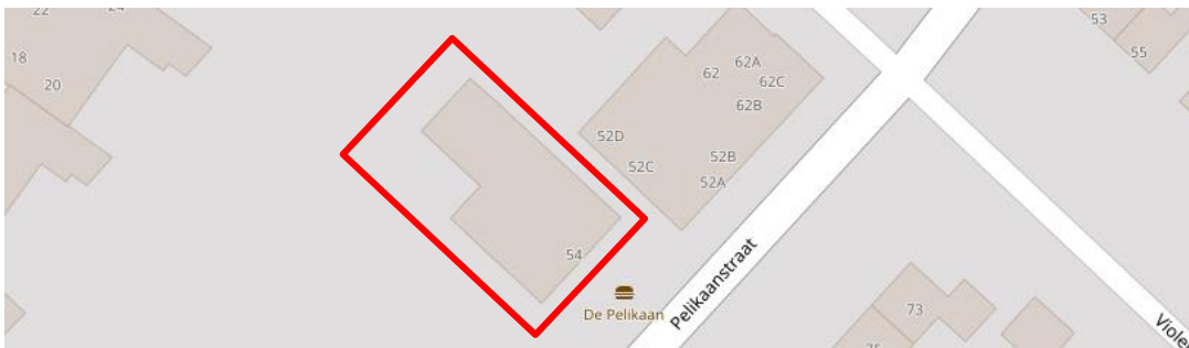
Figuur 2.13. Locatie pand gelegen aan de Pelikaanstraat 54 te Assen.

In figuur 2.13 is de locatie op kaart weergegeven. Figuur 2.14 tot en met 2.16 geven de huidige situatie weer.