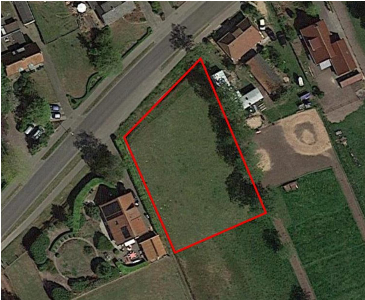
Afbeelding 2.1 Luchtfoto plangebied

Het plangebied heeft op dit moment een agrarische bestemming met daarop een aanduiding voor een wijzigingsbevoegdheid naar woongebied. Het is een open plek in het woningbouwlint aan de Markeweg. Het is onbebouwd en in gebruik als agrarisch grasland. Aan weerszijden is een woonperceel gelegen. De linkerzijde van het plangebied wordt begrensd door een sloot, de rechterzijde van het plangebied wordt begrensd door een bomenrij. Langs de voorzijde van het plangebied loopt een sloot met een bestaande uitweg. De kadastrale grens van het perceel loopt in het midden van de sloot. Het plangebied wordt regulier onderhouden. Afbeelding 2.1 toont een luchtfoto van het plangebied.