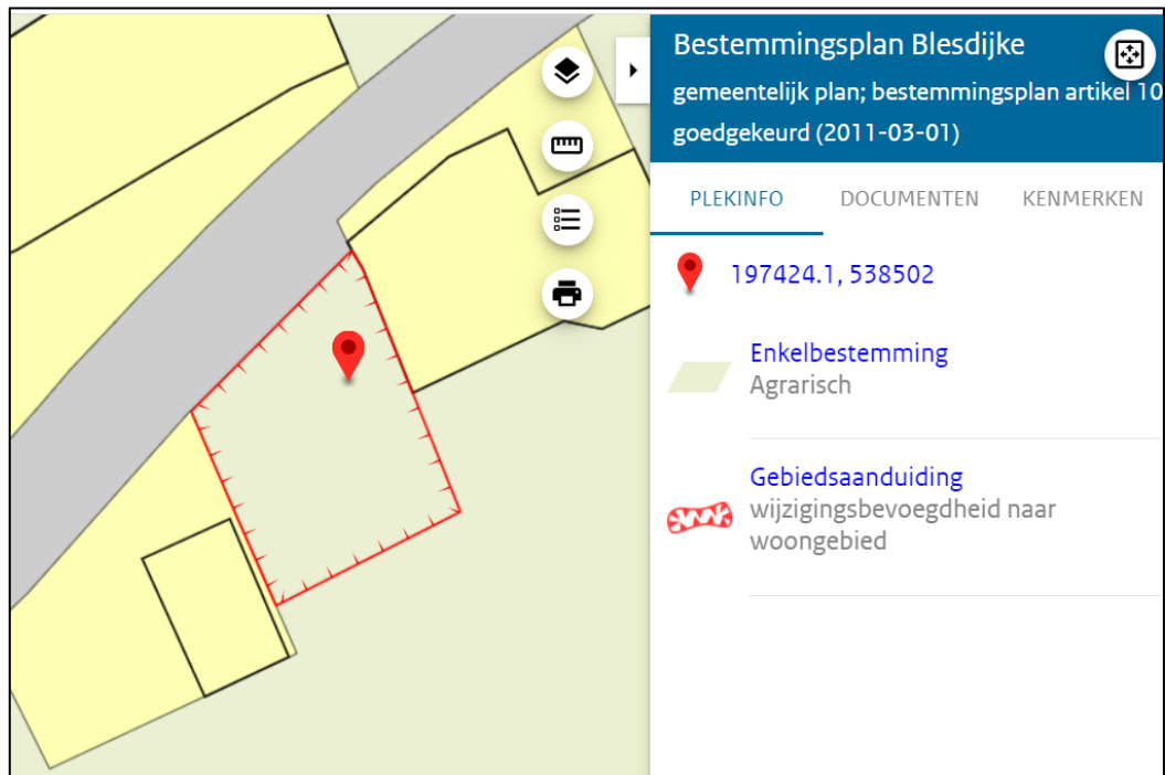
Afbeelding 1.2 plankaart geldend bestemmingsplan