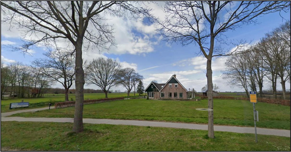
Afbeelding 2.2 Straatbeeld plangebied vanaf de Markeweg