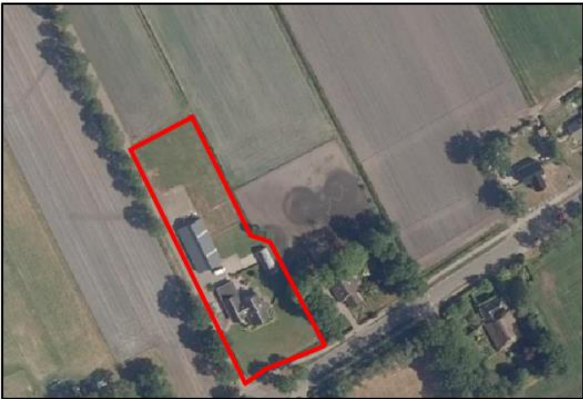
Afbeelding 2.1 Luchtfoto plangebied ten opzichte van de directe omgeving

In afbeeldingen 2.1 en 2.2 zijn respectievelijk een luchtfoto en een straatbeeldfoto van de huidige situatie van het plangebied weergegeven. Het plangebied is op de luchtfoto indicatief met rode lijn aangegeven.