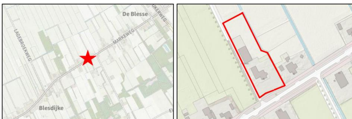
Afbeelding 1.1 Ligging van het plangebied ten opzichte van de omgeving

Het plangebied is gelegen aan de Markeweg 48 te Blesdijke in het buitengebied van de gemeente Weststellingwerf. De locatie is kadastraal bekend gemeente Blesdijke, sectie C en nummer 1883. In afbeelding 1.1 is de ligging van het plangebied ten opzichte van Blesdijke en de (directe) omgeving weergegeven. De rode ster en de rode omlijning geven respectievelijk de locatie en de indicatieve begrenzing van het plangebied weer. Voor de exacte begrenzing van het plangebied wordt verwezen naar de bij dit wijzigingsplan behorende verbeelding.