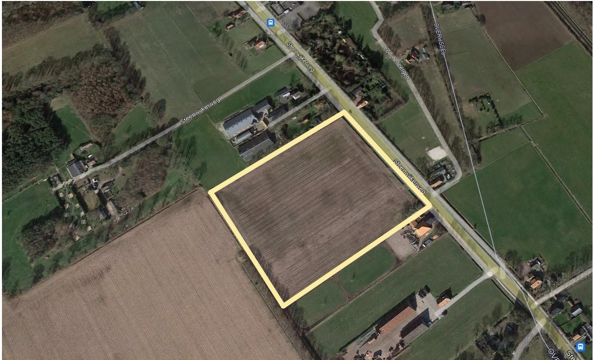
Figuur 2: Geel kader: de onderzochte locatie.

Het voornemen bestaat om het huidige agrarische perceel (zie figuur 2) bouwrijp te maken om ter plaatse een grondgebonden woning te realiseren. Aan de noord- en zuidrand van het perceel zullen bomensingels worden gerealiseerd. Ten behoeve van deze voorgenomen ingreep zullen geen bomen te hoeven worden gekapt, geen sloten of andere wateren te hoeven worden gedempt.