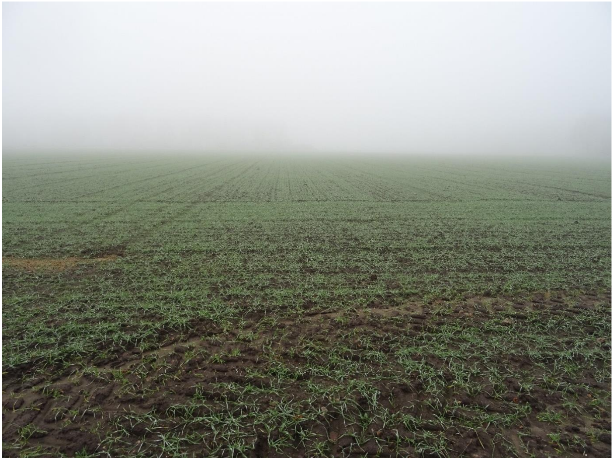
Beeld van de 'flora' ter plaatse.

Door de geplande ingreep zullen geen via de Wnb beschermde plantensoorten in het geding komen.