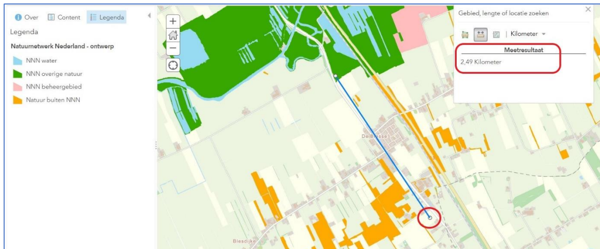
Figuur 3. Ligging van onderzochte locatie ten opzichte van het NNN (groene vlak).

Effectenbeoordeling: De onderzochte locatie valt niet binnen de begrenzing van het NNN, maar ligt daar 2,49 kilometer vandaan. Zie figuur 3. De voorgenomen ingreep zal geen impact hebben op de kernwaarden van het NNN, omdat deze geen directe invloed heeft in de vorm van verstoring van de rust binnen het NNN en er verandert op termijn niets aan de huidige situatie.