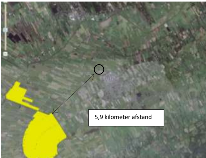
Ligging van Natura2000-gebied in de omgeving van het plangebied. De ligging van het plangebied wordt met de cirkel aangegeven (bron: Ruimtelijke Plannen).

Het plangebied ligt op 5,9 kilometer afstand van gronden die tot Natura2000 behoren. Op onderstaande kaart wordt de ligging van Natura2000-gebied in de omgeving van het plangebied weergegeven.