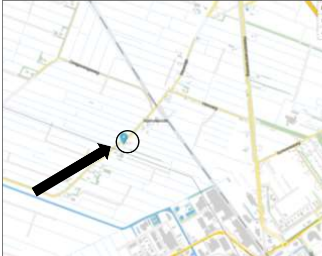
Globale ligging van het plangebied. De ligging van het plangebied wordt met de zwarte cirkel aangeduid (bron kaart: Ruimtelijke Plannen).

Het plangebied is gesitueerd aan de Stadburen in Nijeholtwolde (gemeente Weststellingwerf) en omvat een deel van het erf Stadburen 21 en een perceel agrarische cultuurgrond ten noorden ervan. Het ligt in het buitengebied, circa 650 meter ten noorden van de dorpskern Wolvega. Op onderstaande topografische kaart wordt de globale ligging van het plangebied weergegeven.