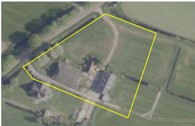
Detailopname van het plangebied. De begrenzing van het plangebied wordt met de gele lijn aangeduid.

Op onderstaande afbeelding wordt het plangebied in detail weergegeven, evenals de begrenzing. Voor een verbeelding van het plangebied wordt naar de fotobijlage verwezen.