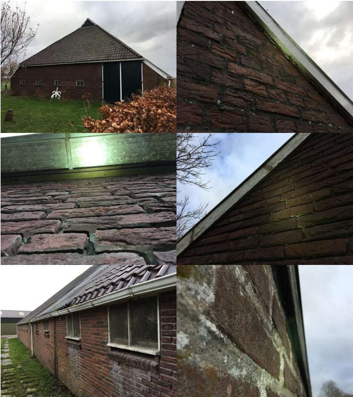
Bijlage 3. Fotobijlage. Impressie van het plangebied en de directe omgeving.