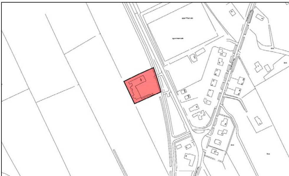
Figuur 1. De ligging van het plangebied

Het plangebied betreft het perceel Oldeberkoperweg 43, dat aan de westelijke rand van Zandhuizen ligt. De begrenzing van het plangebied is afgestemd op het huidige bestemmingsvlak van het perceel. De ligging van het plangebied is gevisualiseerd in figuur 1.