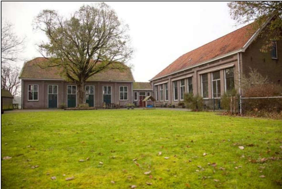
Figuur 3. Aanzicht op de bebouwing