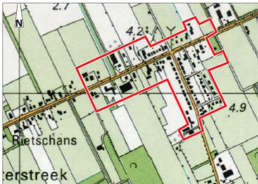
Figuur 4. Bebouwingscontour Oosterstreek

In februari 2002 is het structuurplan voor de hele gemeente Weststellingwerf vastgesteld door de gemeenteraad. Het structuurplan is opgesteld vanuit de wens om alle lopende projecten te kunnen inpassen en om kaders te kunnen scheppen voor een toekomstige ontwikkeling van de gemeente. Het ruimtelijk beleid wordt hierbij gekoppeld aan de ruimtelijke kwaliteit, de identiteit en de duurzaamheid van de gemeente.