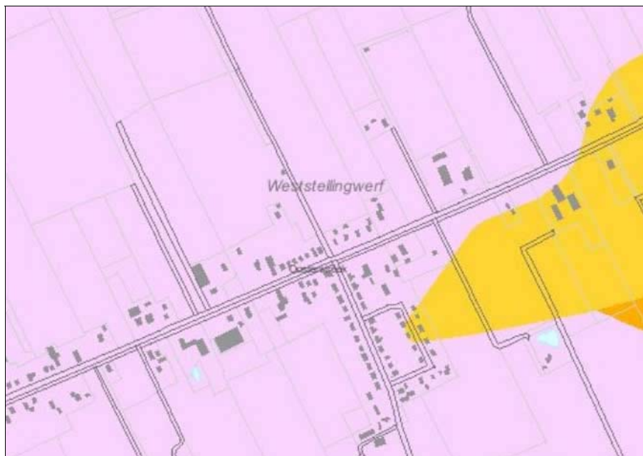
Figuur 5. Advies FAMKE Steentijd

Voor de IJzertijd-Middeleeuwen kent het plangebied het advies 'Middeleeuwen: karterend onderzoek 3' (zie figuur 6).