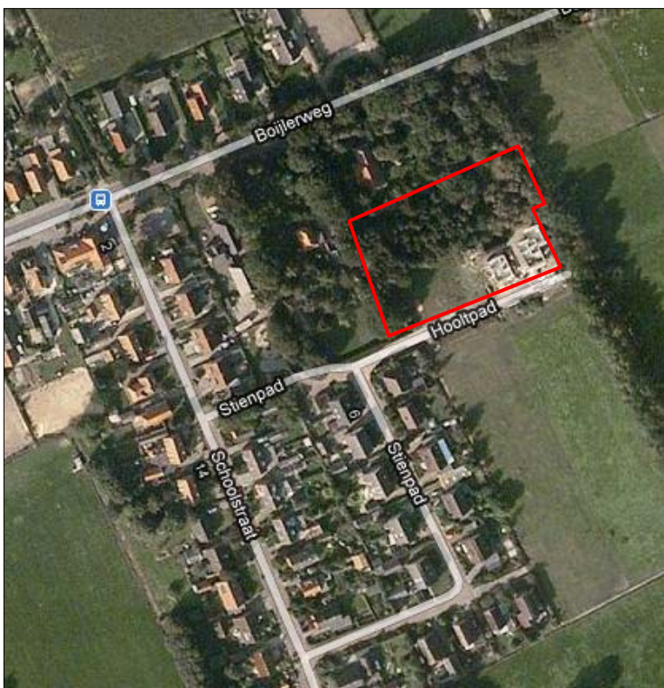
Figuur 1. Globale ligging plangebied

Dit bestemmingsplan heeft betrekking op vier percelen aan het Hooltpad 1 tot en met 7 in het dorp Oosterstreek. Het dorp is gelegen in de gemeente Weststellingwerf. De gemeente Weststellingwerf heeft in 2009 een kapvergunning verleend voor de kap van de daar aanwezige bossages om de betreffende gronden als tuin te kunnen gebruiken bij de aangrenzende woonpercelen. De bewoners hebben de bossages inmiddels volledig verwijderd en in gebruik genomen als tuin. De percelen hebben op dit moment nog een agrarische bestemming die formeel het gebruik als tuin niet toestaat. De gemeente wil deze bestemming dan ook veranderen in een bestemming die het gebruik als tuin bij naastliggende woningen mogelijk maakt. Het bestemmingsplan 'Hooltpad 1 t/m 7 Oosterstreek' is opgesteld om de percelen aan het Hooltpad de bestemming 'Woongebied' te geven. Ter wille van de volledigheid zijn de volledige woonpercelen bij het plan betrokken. De ligging van het plangebied is globaal in figuur 1 weergegeven.