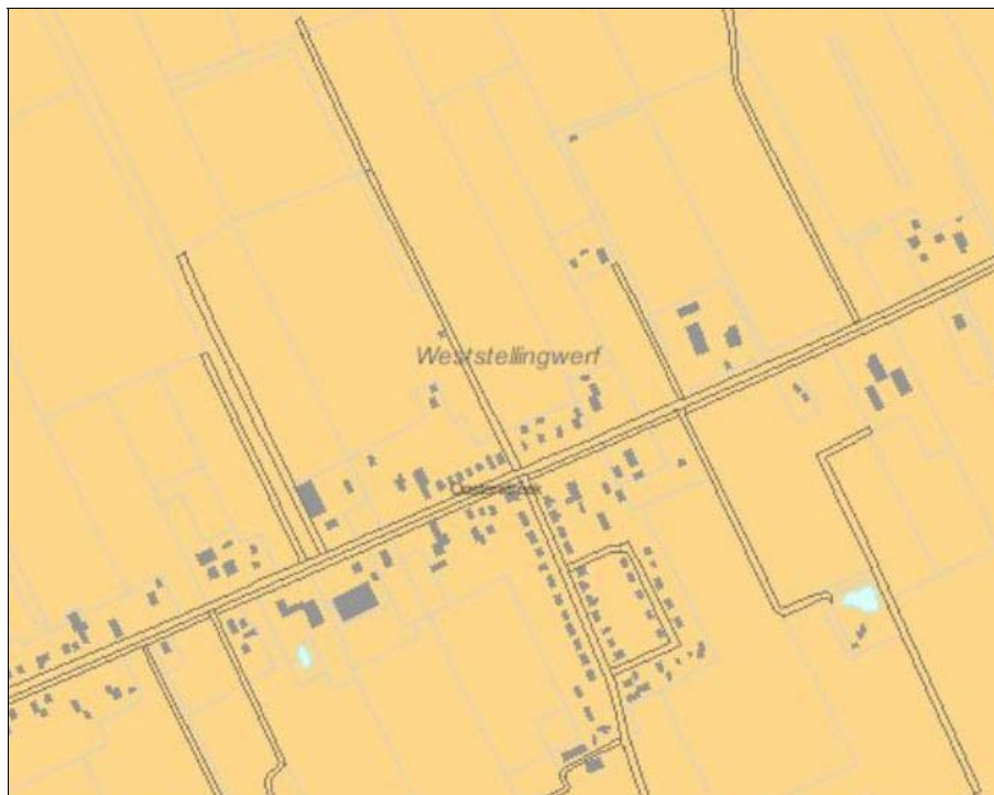
Figuur 6. Advieskaart IJzertijd-Middeleeuwen

In deze gebieden kunnen zich archeologische resten bevinden uit de periode midden Bronstijd-vroege Middeleeuwen. Het gaat hier dan met name om vroeg- en volmiddeleeuwse veenontginningen. Daarbij bestaat de kans dat er zich huisterpjes uit deze tijd in het plangebied bevinden. Ook de wat oudere