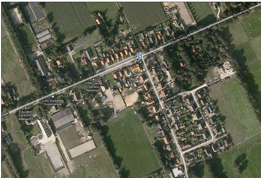
Figuur 2 . Het dorp Oosterstreek

In de nabije toekomst wordt uitbreiding van het dorp voorzien achter de woningen aan het Stienpad. Hier kunnen dan in twee fases nieuwe woningen gerealiseerd worden. Om dit mogelijk te maken zal voor dit plangebied een apart bestemmingsplan gemaakt worden en dus ook een aparte procedure gevolgd worden.