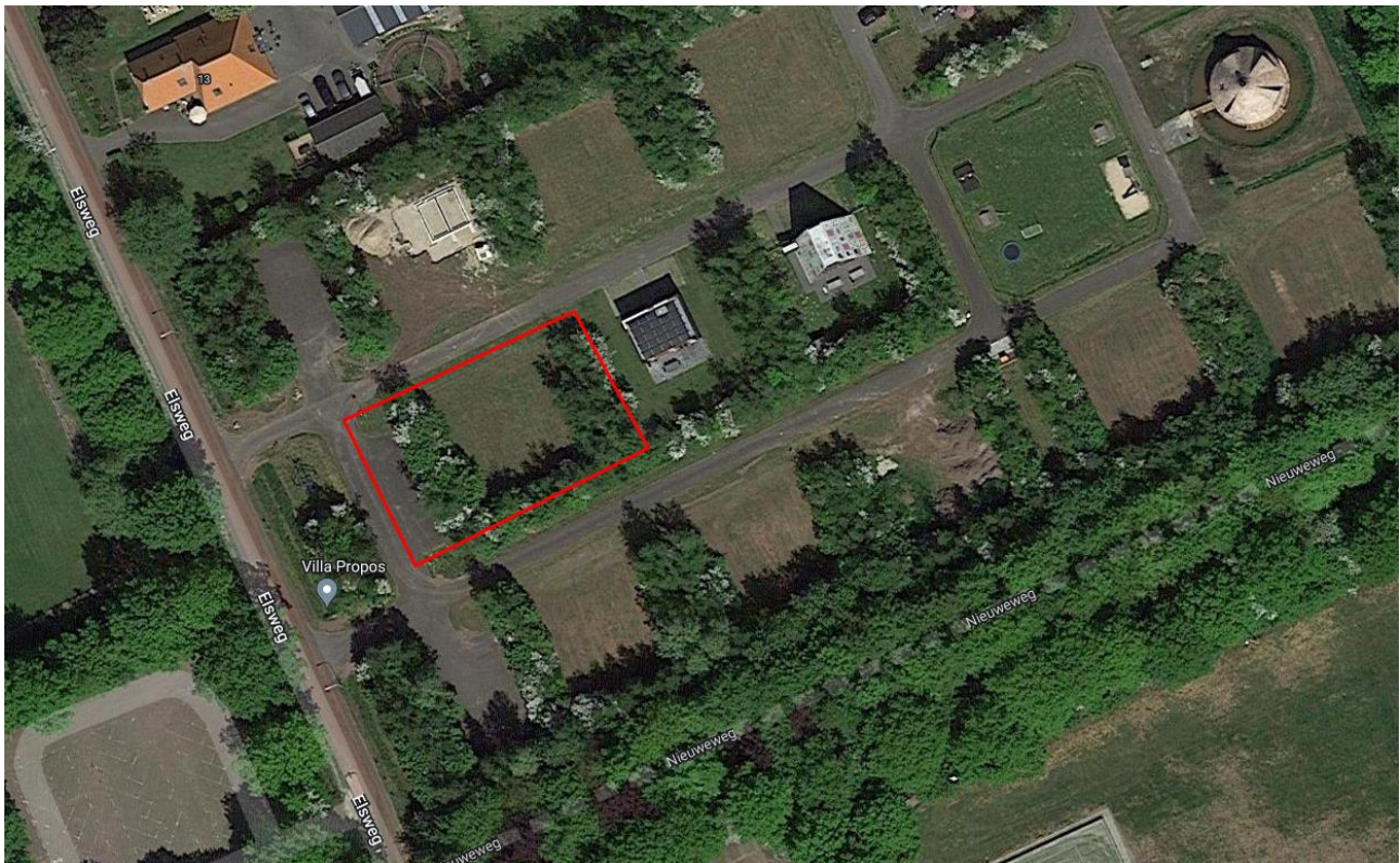
Afbeelding 1.3: Luchtfoto van het projectgebied (binnen het rode kader).