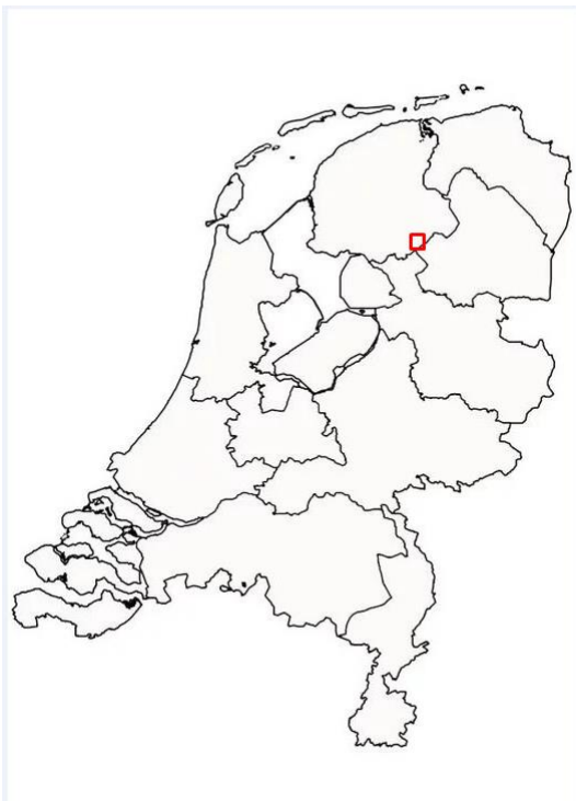
Afbeelding 1.1: Noordwolde, provincie Friesland