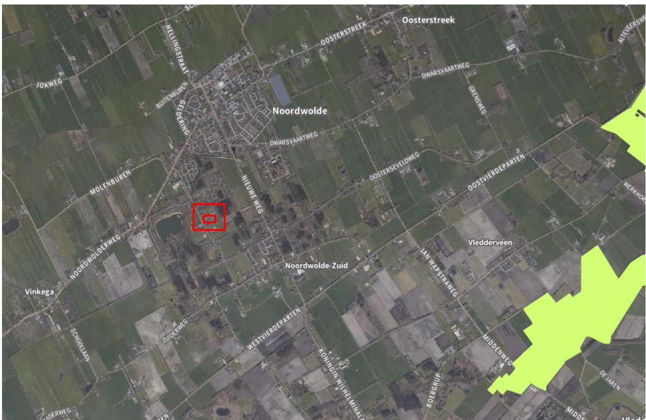
Afbeelding 4.1: Ligging van het projectgebied (rood kader) t.o.v. Natura 2000-gebied (groen).

Het projectgebied is niet direct zichtbaar vanuit omliggende Natura 2000-gebieden. Van optische verstoring van soorten in Natura 2000-gebieden is derhalve geen sprake. Gelet op de ligging van het projectgebied en de beperkte impact van de ingreep, kan verstoring van soorten in Natura 2000-gebieden door licht en geluid op voorhand worden uitgesloten. Een substantieel, negatief effect van de voorgenomen ontwikkeling op de stikstofemissie en daarmee op Natura 2000-gebieden is niet aannemelijk, maar kan desgewenst nader onderzocht worden middels een AERIUS berekening. Er is geen sprake van significante gevolgen voor Natura 2000-gebieden, het aanvragen van een vergunning op grond van de Wet natuurbescherming is niet aan de orde.