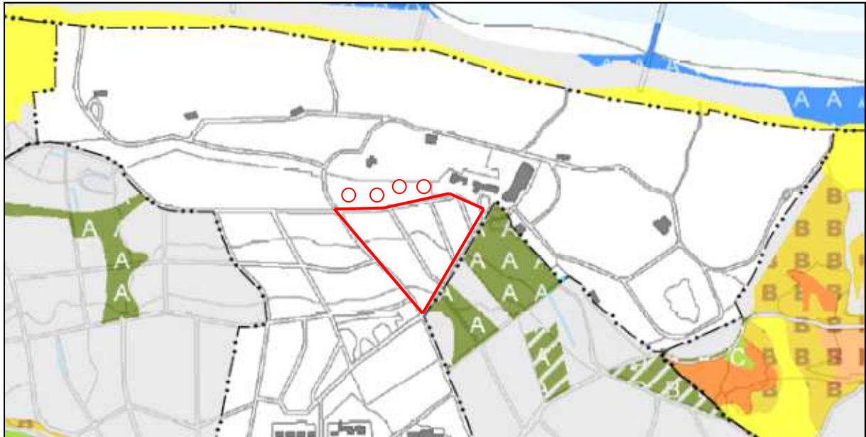
Kaart 2. Het plangebied (binnen rode lijn). Ligging t.o.v. de Natura2000-gebieden en de voorkomende habitattypen.

Rood: plangebied, locatie voor de plaatsing van de lodges. Rode cirkels: locatie eerder geplaatste lodges.