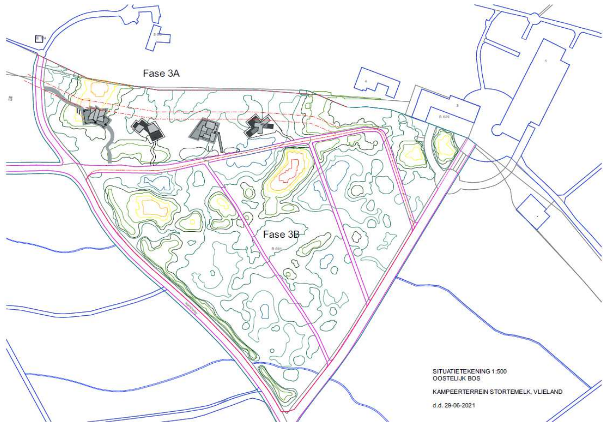
Situatieschets plaatsing lodges. De inrichting van het terrein betreft fase 3b. In roze aangegeven de bestaande bospaden. Tevens is de bestaande duingeformorfologie aangegeven. In het gebied van fase 3A in grijs de eerder geplaatste lodges.