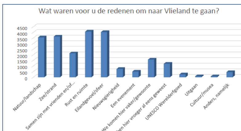
Figuur: overgenomen uit Eindrapport bezoekersonderzoek Vlieland (2016)

Het strand van Vlieland is mooi en relatief schoon. Het heeft een hoge natuurwaarde. Natura 2000 heeft het bestaande gebruik beschreven en onder meer vastgelegd op een overzichtskaart. Dit is gedaan om de natuurwaarde te kunnen behouden en te kunnen bewaken. De inpasbaarheid van opstallen in de landschappelijke omgeving, de aard van activiteiten die mensen uitvoeren op het strand, de mate van vervuiling; al deze onderwerpen hebben te maken met de natuurwaarde en het behoud hiervan. Duitse als Belgische potentiële kustbezoekers vinden een mooie natuur en schone en veilige stranden het belangrijkste aldus een onderzoek uit 2015. 1 Door het online gastenonderzoek weten we inmiddels dat een hoog percentage Nederlandse bezoekers van ons eiland “zee en strand, natuur en landschap” noemt als reden om naar Vlieland te gaan.