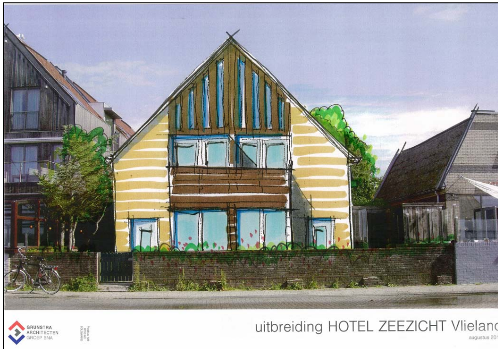
Figuur 5. Impressie vooraanzicht uitbreiding Zeezicht (Grunstra architecten)