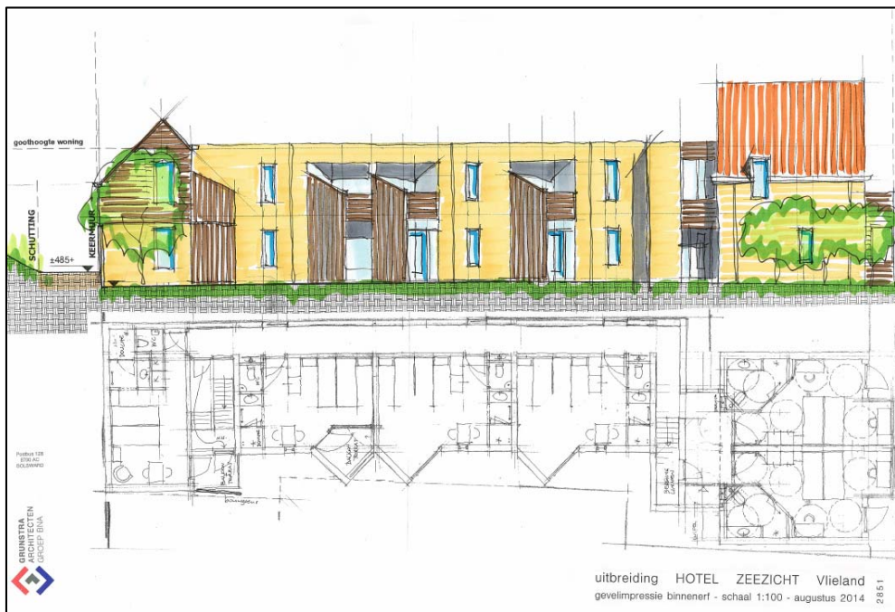
Figuur 6. Impressie zijanzicht uitbreiding Zeezicht (Grunstra architecten)