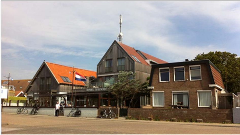
Figuur 3. Hotel Zeezicht (links) en woning Havenweg 2 (rechts)