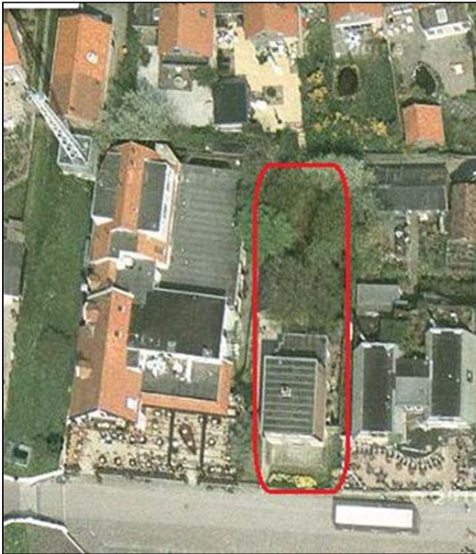
Figuur 2. Luchtfoto ligging plangebied (detail)