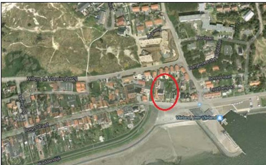
Figuur 1. Luchtfoto ligging plangebied

Het plangebied voor dit bestemmingsplan is het perceel Havenweg 2 te Vlieland en bevindt zich naast Hotel Zeezicht. De Havenweg ligt in het verlengde van de Dorpsstraat. Onderstaand figuur geeft de ligging van het plangebied weer.