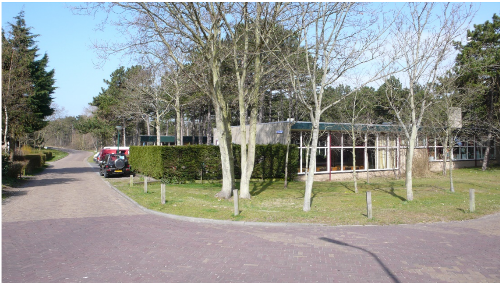
Figuur 3. Foto vanaf de kruising Rozenbottelweg-Lutinelaan. Rechts de huidige VMBO. Links de Rozenbottelweg die aan het einde linksaf het duin opdraait.

De intentie van de gemeente is om meerdere maatschappelijke functies in één gebouw te huisvesten, waarmee een multifunctioneel, openbaar gebouw ontstaat dat zowel overdag als s'avonds gebruikt wordt. De gemeente noemt deze ontwikkeling de NieuweSchool.