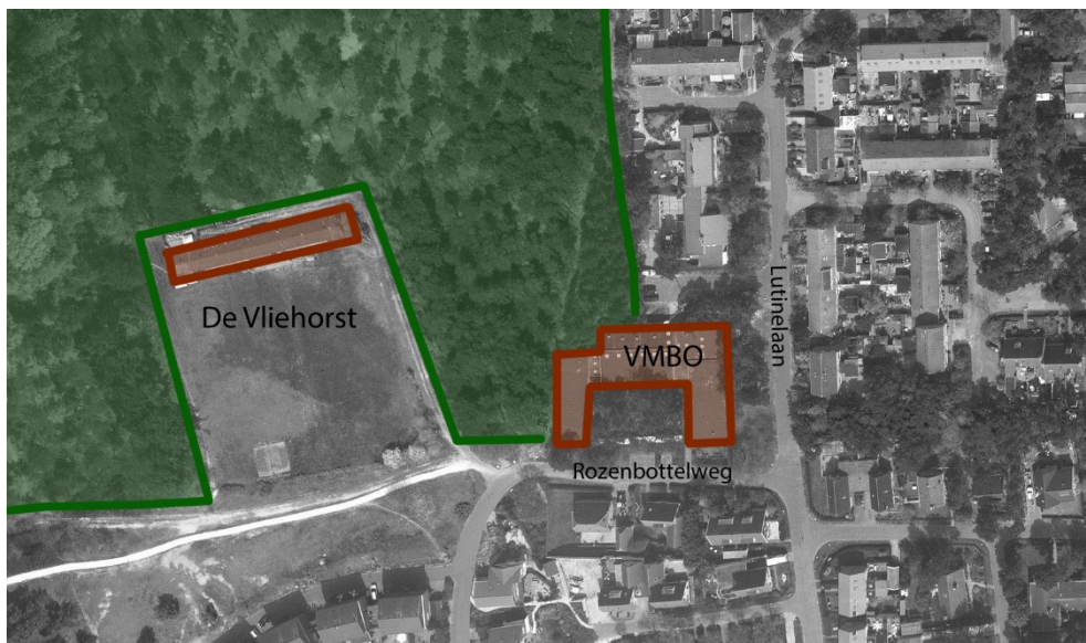
Figuur 7. Huidige relatie met het bos

Naast het toepassen van vegetatie als afscherming kunnen ook heuveltjes en glooiingen in het terrein gebruikt worden. Daarvoor kunnen de bestaande hoogteverschillen gebruikt worden, maar is het toevoegen of aanpassen van heuveltjes en glooiingen toegestaan.