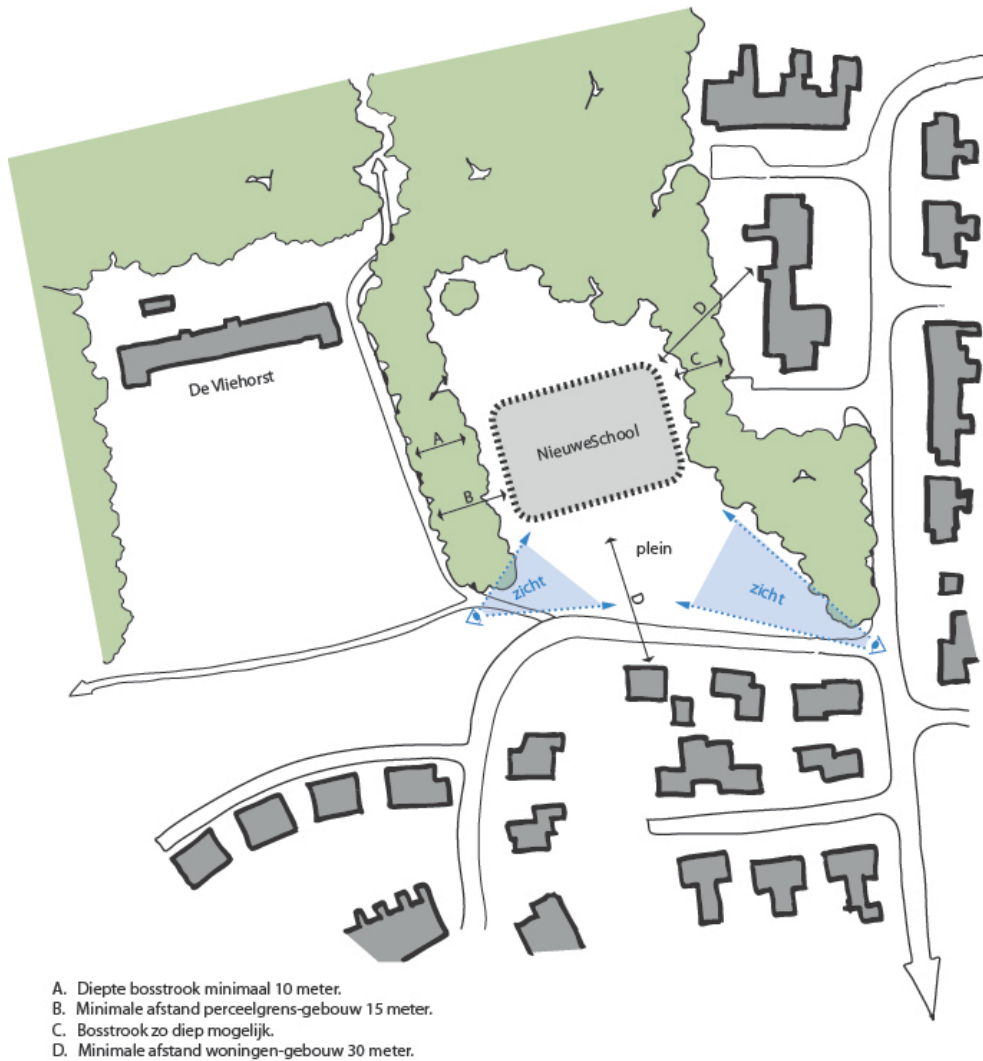
Figuur 9. Overzichtskaart met uitgangspunten beeldkwaliteit