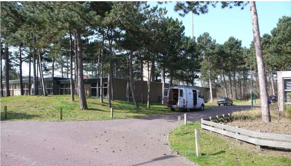
Figuur 5. Foto vanaf de Lutinelaan. Uiterst rechts het politiebureau. Links de VMBO, deels verscholen achter een klein heuveltje met naaldbomen.