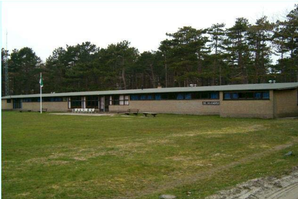
Figuur 4. Foto De Vliehorst.