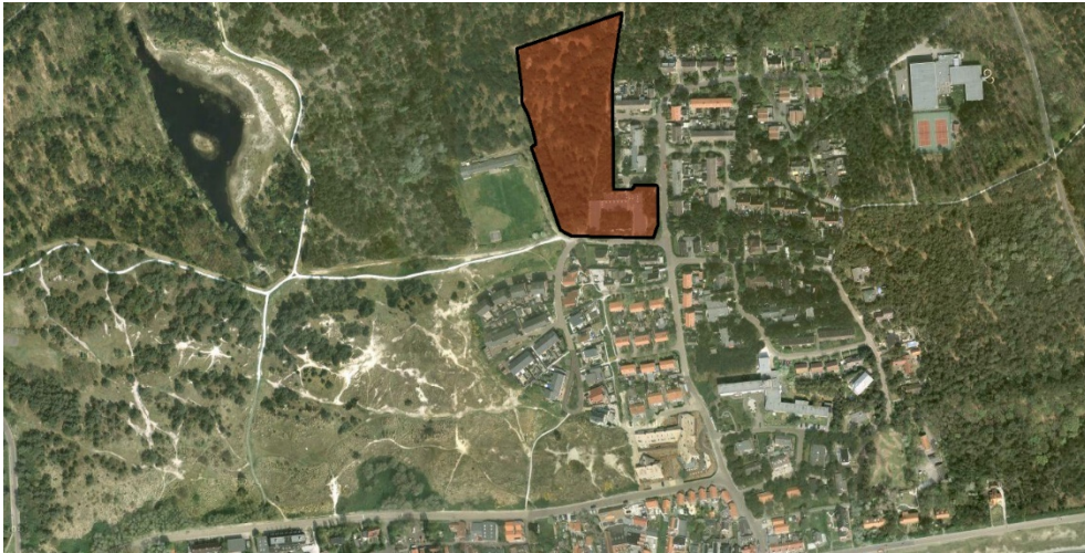
Figuur 1. Overzichtskaart noordkant Oost-Vlieland