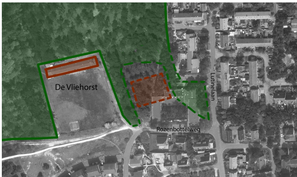
Figuur 8. Nieuwe relatie met het bos

Ten behoeve van dit doel zijn twee beeldthema's ontwikkeld waarbinnen de uitwerking van de bebouwing plaats kan vinden. Het gaat daarbij om vorm-, kleur- en materiaalgebruik dat ofwel afgestemd wordt op het duinlandschap van Vlieland dan wel op het omringende bos.