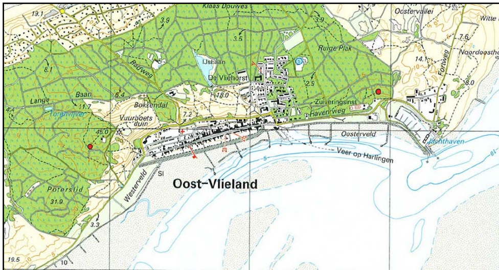
Figuur 1. De ligging van het plangebied

De planbegrenzing wordt in hoofdlijn bepaald door de bovenstaande bestemmingsplannen. Op perceelsniveau wordt een aantal ondergeschikte wijzigingen in de plangrens aangebracht. De sport- en recreatievoorzieningen, waaronder het zwembad en de jachthaven met bijbehorend bedrijventerrein, worden buiten het bestemmingsplan Vlieland Kom gelaten. Hiervoor worden afzonderlijke bestemmingsplannen opgesteld.