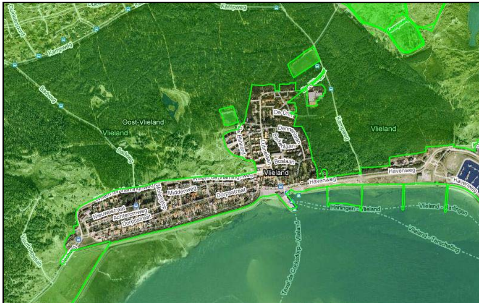
Figuur 3. EHS-gebieden rond het dorp

De locatie 'Vliehorst' en het natuurgebied tussen de Willem de Vlaminghweg en Duinwijk behoren tot de EHS. De EHS is als groen gebied op figuur 3 aangegeven.