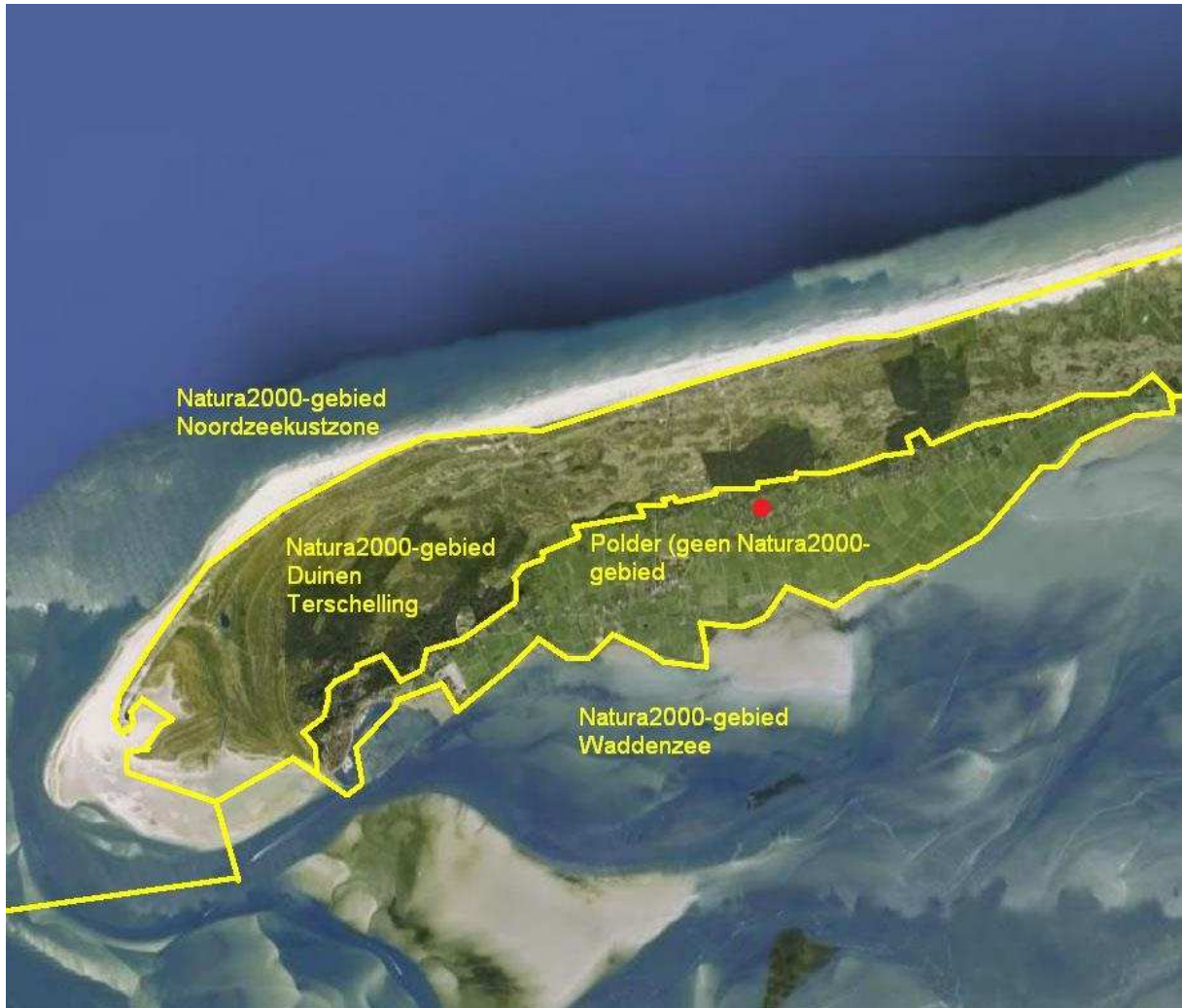
Kaart 2: De begrenzing van de Natura2000-gebieden op Terschelling (gele lijn). Rood: ligging van het plangebied.

De herinrichting van recreatieterrein Blommenlandsje, Formerum – Terschelling, in relatie tot de natuurbeschermingswetgeving, een voortoets.