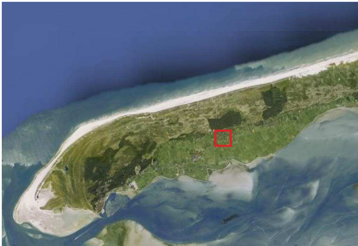
Kaart 1. Ligging van het plangebied op Terschelling (rood kader)