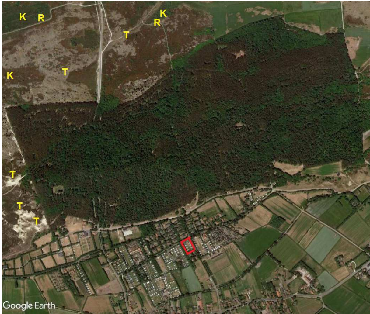
Kaart 7: Vogelrichtlijn-soorten broedvogels. Broedlocaties van tapuit (T), kiekendieven (K) en rietzanger (R). Rood kader: plangebied.

De herinrichting van recreatieterrein Blommenlandsje, Formerum – Terschelling, in relatie tot de natuurbeschermingswetgeving, een voortoets.