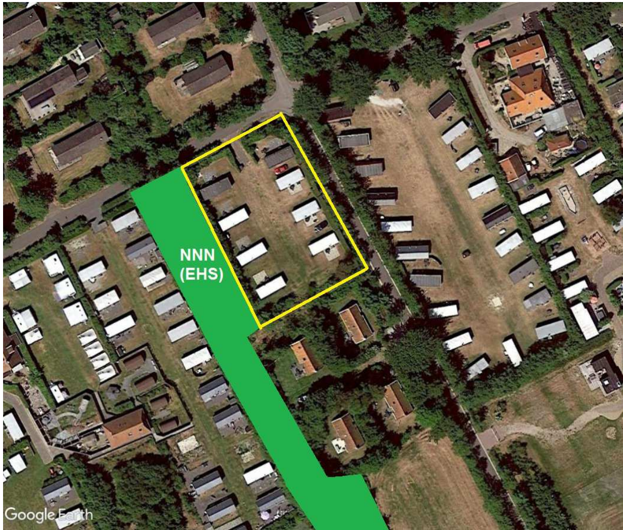
Kaart 8. Natuur Netwerk Nederland (Ecologische Hoofdstructuur).

De herinrichting van recreatieterrein Blommenlandsje, Formerum – Terschelling, in relatie tot de natuurbeschermingswetgeving, een voortoets.