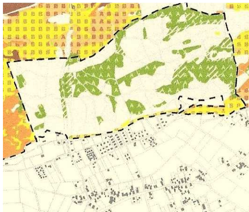
Kaart 4. De habitattypen van het Natura2000-gebied ten noorden van het plangebied (DLG, 2015).

De niet ingekleurde percelen zijn naaldbossen die niet tot een habitattype behoren.