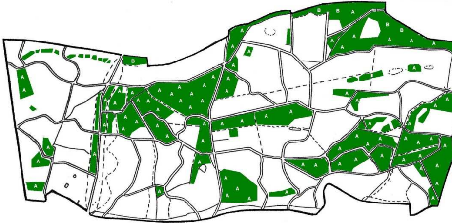
Kaart 3. Formerumberbos.

Groen: percelen met habitattype H2180 – Atlantische duinbossen.