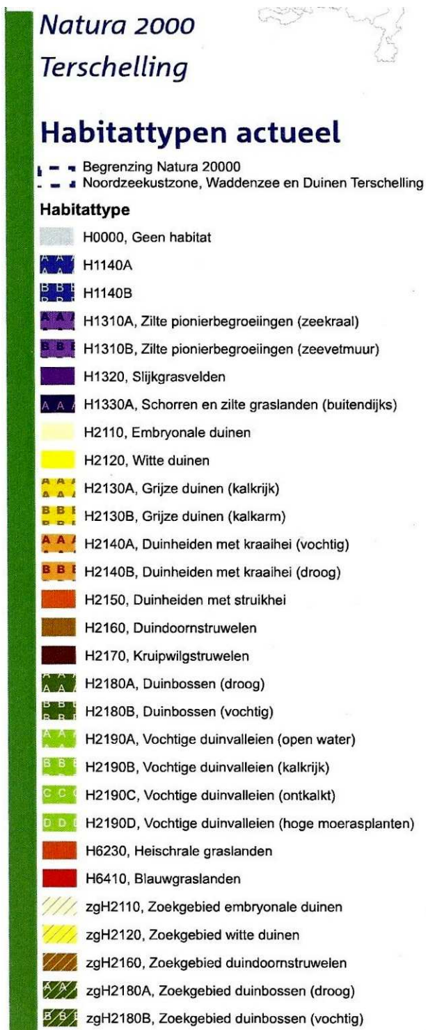
Kaart 5. De legenda behorende bij kaart 4 (DLG, 2015).