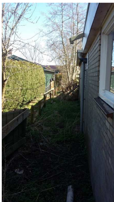
Foto 2: Restant elzensingel noordzijde 't Roefje, met ruigtekruidenvegetatie.