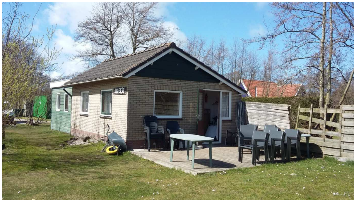
Foto 1. Recreatiewoning 't Roefje.