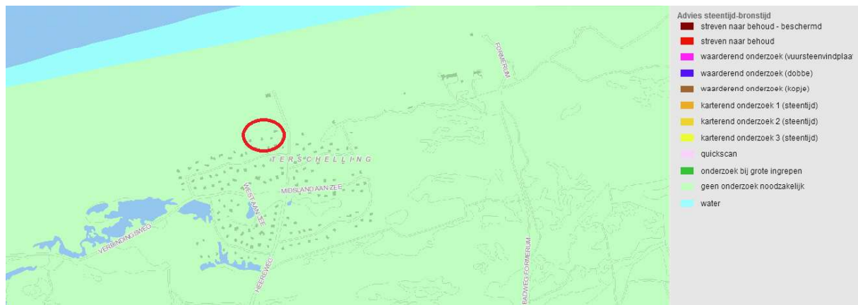
Afbeelding 2. De uitsnede van de FAMKE voor de periode steentijd-bronstijd. Het perceel Midland aan Zee 459A te Midland is met een rode cirkel aangegeven.

Uit de gegevens in ARCHIS blijkt ook dat de kans op archeologische resten zeer klein wordt geacht. Er zijn geen eerdere archeologische onderzoeken, al bekende archeologische monumenten, waarnemingen of vondsten gemeld binnen of in de directe omgeving van het plangebied. Alle bekende archeologische waarden bevinden zich in de polder op het zuidelijke deel van het eiland. De dichtstbijzijnde waarneming (nr. 427784) ligt op 1,8 km afstand en omvat een vindplaats uit de nieuwe tijd.