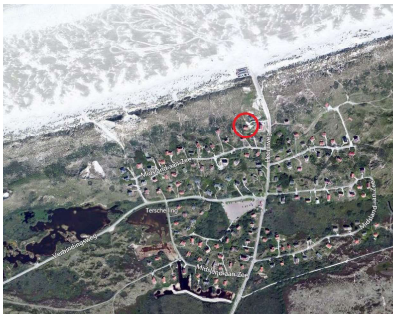
Afbeelding 1. Luchtfoto van het plangebied perceel Midsland aan Zee 459A te Midsland, aangegeven met een rode cirkel

Hartelijk dank voor uw aanvraag voor een archeologische quickscan het perceel Midsland aan Zee 459A te Midsland (kadastraal gemeente Terschelling, sectie E nummer 644, Afbeelding 1).