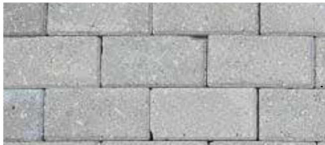
Betonsteen aansluitend op bestaande situatie (grijze stenen voor de terrassen 1 en 2) Parkeerplaatsen d.m.v waterdoorlatende verharding