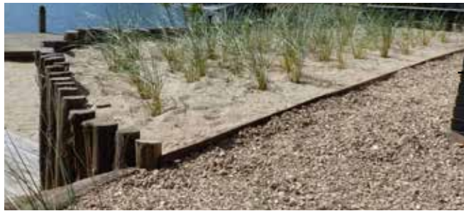
Schelpen / grindpad