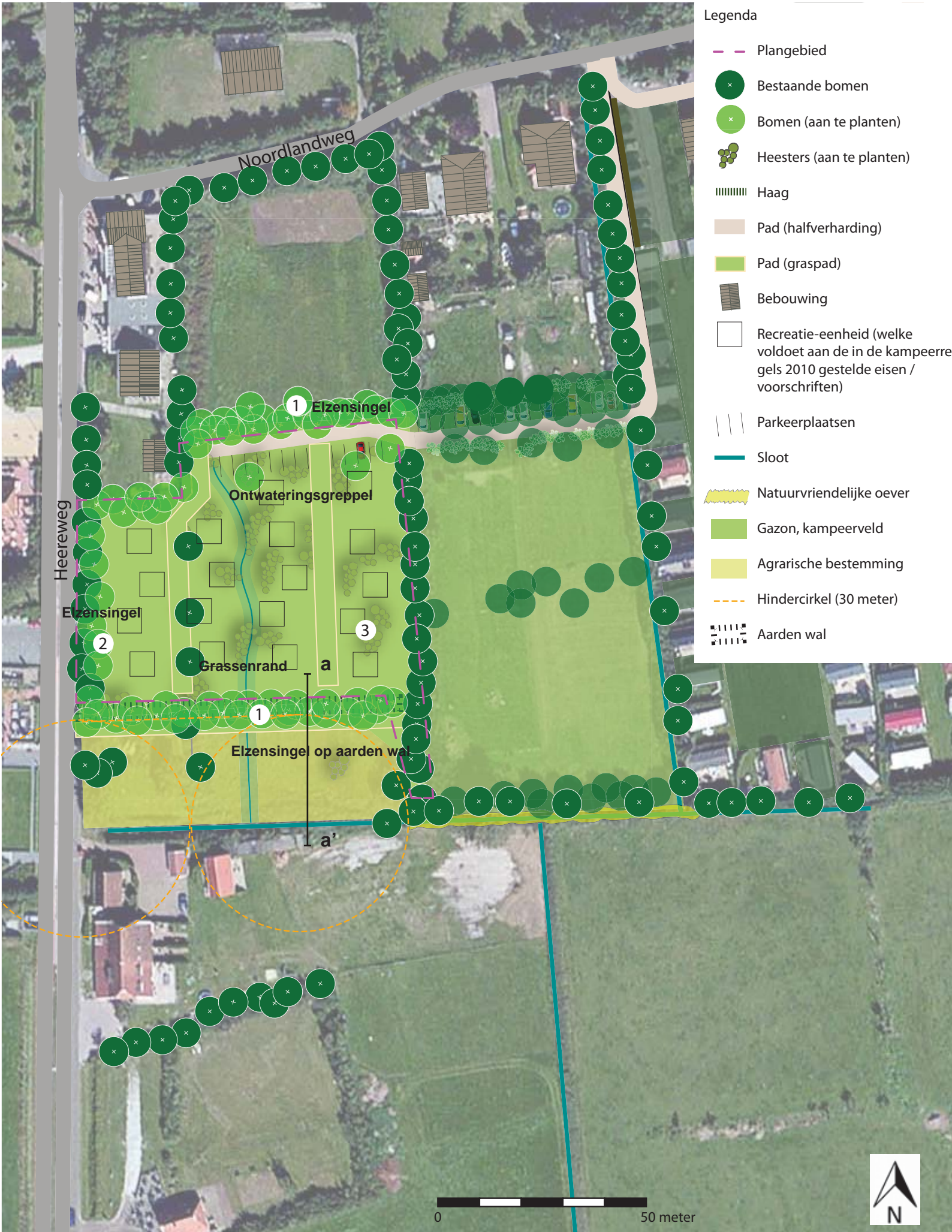
Afbeelding 13 Beplantingsplan