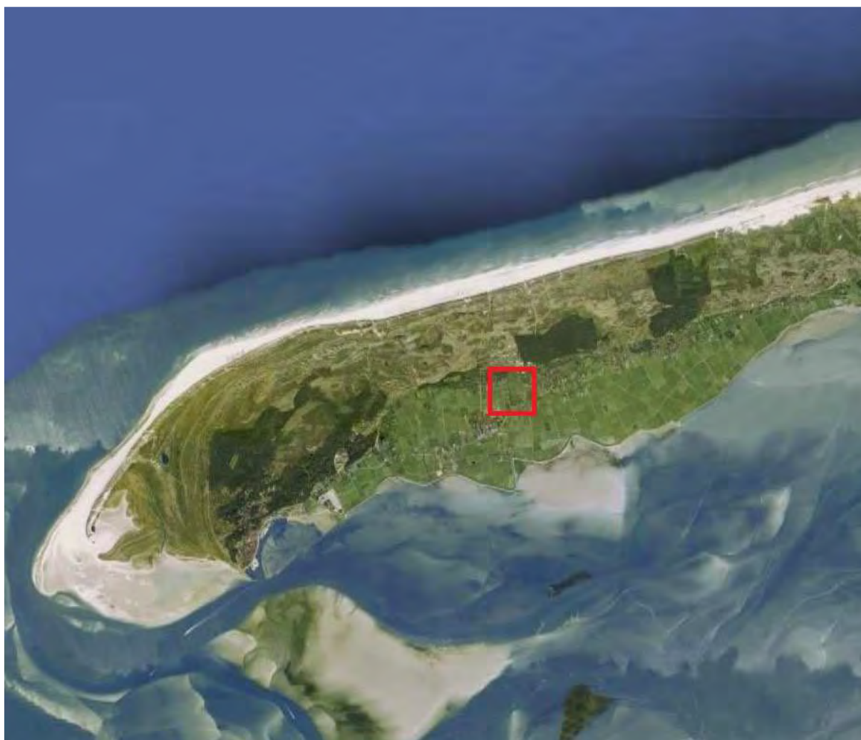
Kaart 1. Ligging van het plangebied op Terschelling (rood kader).

Het plangebied en de omgeving is in mei 2016 op de aanwezigheid van beschermde natuurwaarden geïnventariseerd.