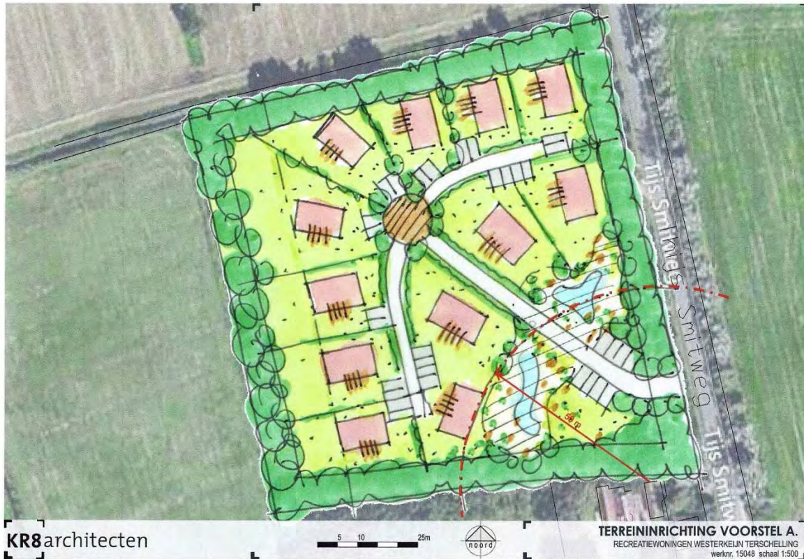
Kaart 3. Het plankaartje van de inrichting van het terrein. Op de Westerkeijn worden geen recreatiewoningen gebouwd binnen een afstand van 50 meter vanaf de bebouwing ten zuiden van het perceel (rode onderbroken cirkeldeel).

De bouw van een klein park met recreatiewoningen op het terrein van de Westerkeijn, Midsland-Noord -Terschelling; een ecologische beoordeling van het plan