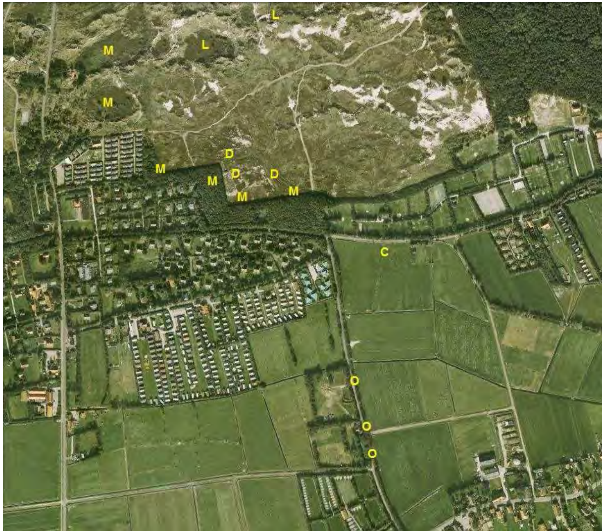
Kaart 7. Door de Flora- en faunawet beschermde soorten (Zumkehr, 2007):

D = Ronde zonnedaauw ( Drosera rotundifolia )