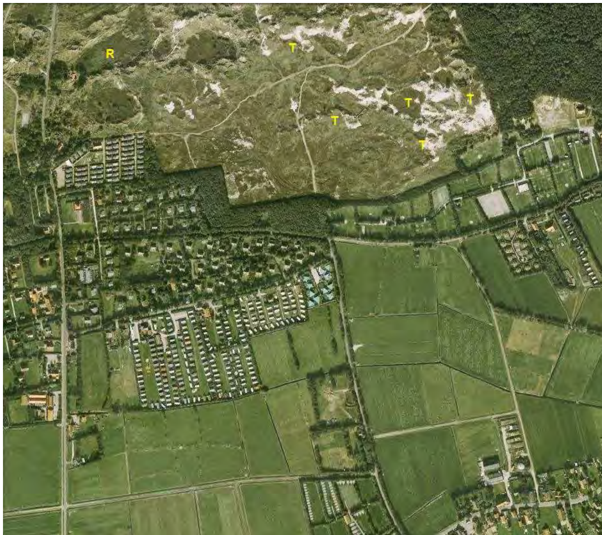
Kaart 6. Broedlocaties van tapuit (T) en rietzanger (R).