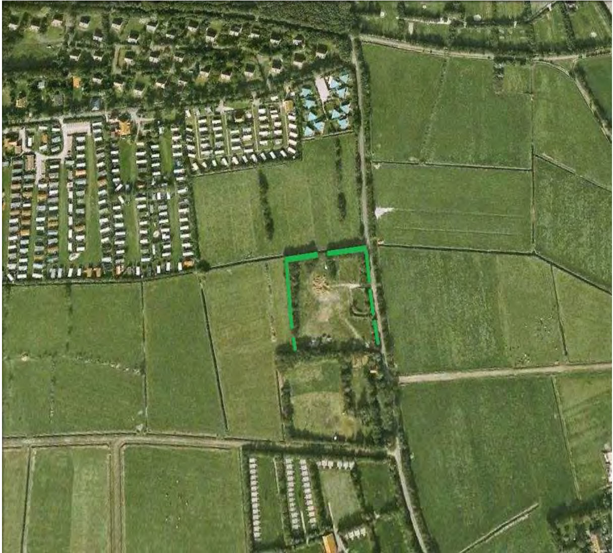
Kaart 9. Boomsingels als onderdeel van de planologische EHS (groen).

De bouw van een klein park met recreatiewoningen op het terrein van de Westerkeijn, Midsland-Noord -Terschelling; een ecologische beoordeling van het plan