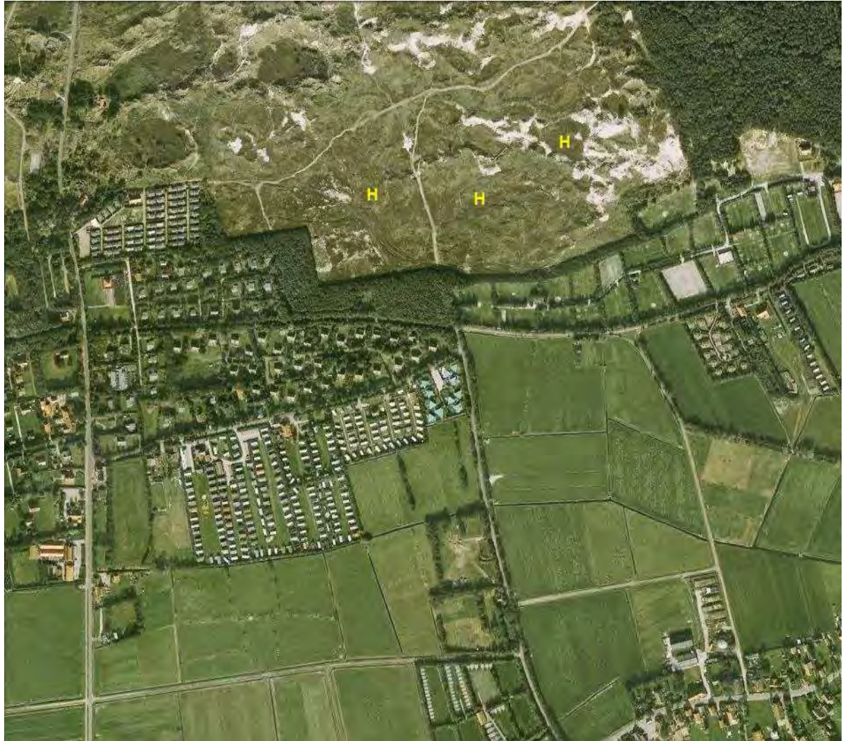
Kaart 8: De populatie van de kommvlinder Hesperia comma op de Landerumerheide (H) (Zumkehr, 2013).