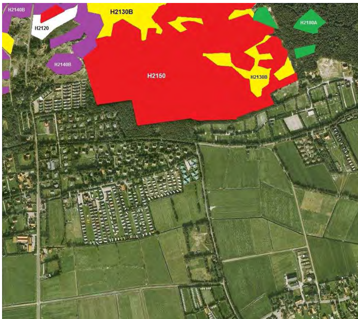
Kaart 5. De habitattypen van de Landerumerheide in de omgeving van de Westerkeijn: