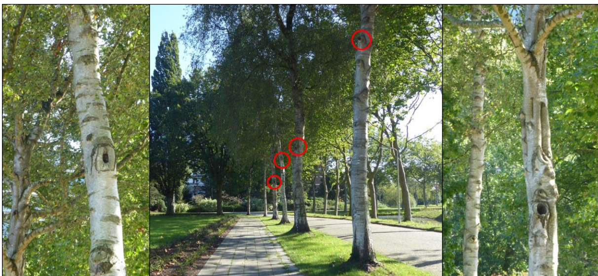
Figuur 2.2. Impressie zuidelijke bomenrij met boomholten.

Vleermuizen verblijven voornamelijk in gebouwen of boomholtes. In het plangebied zijn geen gebouwen aanwezig en geen boomholten aangetroffen. In de bomenrij ten zuiden van het plangebied (berken) zijn echter meerdere boomholten aangetroffen, in vrijwel elke boom (figuur 2.2). In hoeverre de holtes (vooral naar boven) zijn ingerot, bepaalt of de holtes geschikt zijn als verblijfplaats voor boom-bewonende vleermuissoorten die in Drachten en omgeving voorkomen zoals rosse vleermuis, ruige dwergvleermuis, watervleermuis en baardvleermuis (bron: NDFF). Indien deze bomen worden gekapt, kunnen negatieve effecten van de werkzaamheden op verblijfplaatsen van vleermuizen in boomholten niet op voorhand worden uitgesloten. Ook verdient het de aanbeveling om lichtuitstraling tussen zondergang en zonsopkomst in de richting van deze bomen te voorkomen dan wel tot een minimum te beperken.