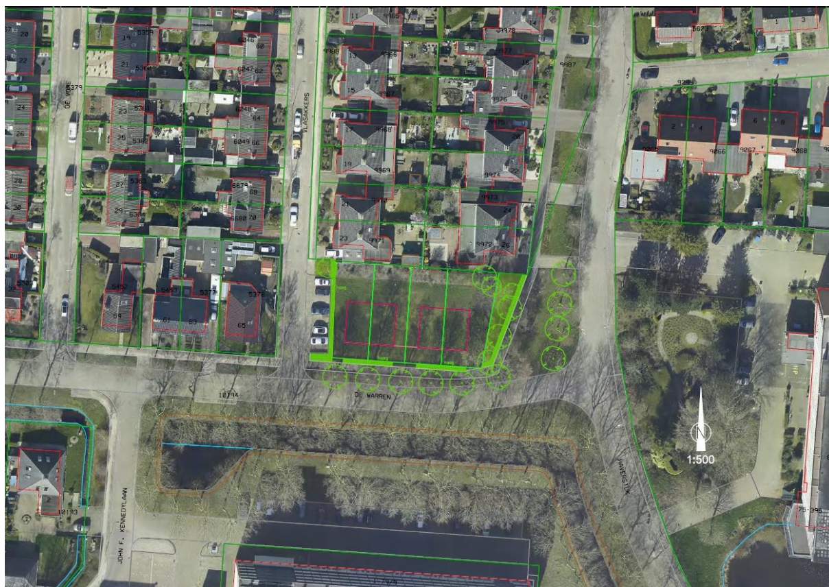
Figuur 1.2. Impressie planvoornemen plangebied.

Het planvoornemen bestaat uit de realisatie van vier woningen op het grasland perceel (figuur 1.2). Met het planvoornemen worden er mogelijk bomen geroid.