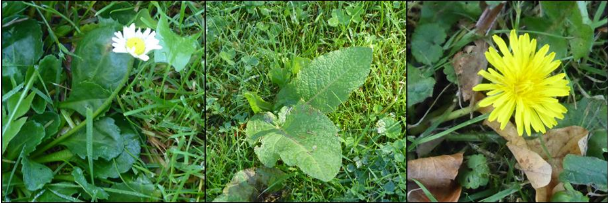
Figuur 2.1. Impressie van de flora in het plangebied.

Het plangebied wordt gekenmerkt door grasland met soorten zoals onder andere Engels raaigras, brede weegbree, paardenbloem, hondsdrif, zuring en madelief. Het plangebied is vanwege voedselrijke habitateigenschappen ongeschikt voor beschermde flora en deze zijn ook niet aangetroffen.